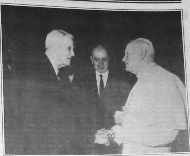
politice gândite de înaintașii jertfiiți în bezna comunistă! Oamenii eternității noastre ne-au deschis drumul spre lumină. Să-l urmăm!