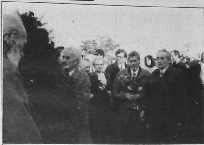
După slujba de la „Domnița Bălașa”, conducerea CDR a depus coroane la monumentul Seniorului, de lângă biserica Kretzulescu

Ciclu de comemorări a continuat luni, 11 noiembrie, când TVR 2, la orele 18.30, a realizat, prin dl Arachelian, o emisiune de omagiere a dlui