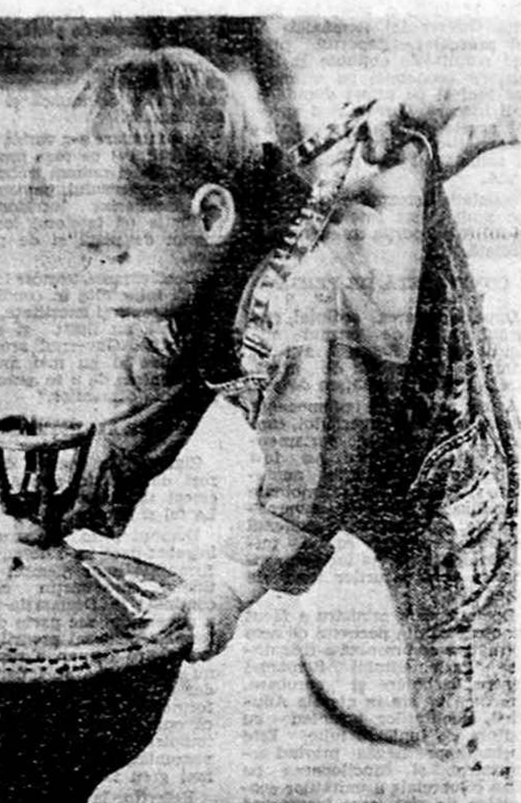
Cit ne mai tin curelele?