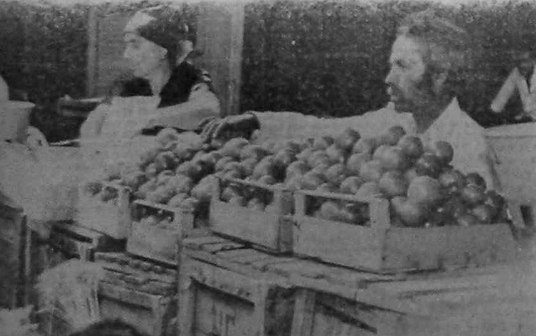
Piața e liberă pentru toți producătorii

S-au adus lame de bărbierit sau e un... miraj?