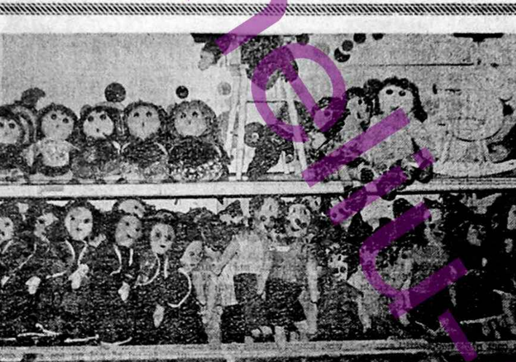
Papusi - monstu la raionul de jucarii din magazinul gigant Bucur-Obor