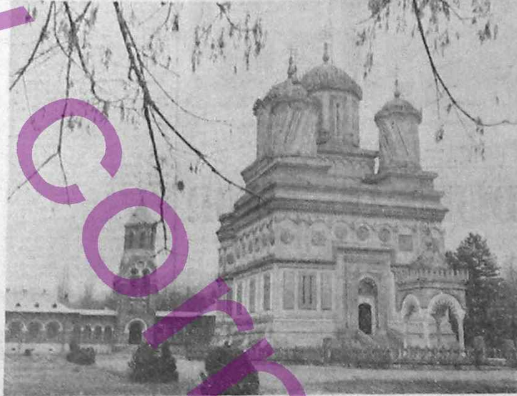
MĂNĂȘTIREA CURTEA DE ARGEȘ

În acest partid în aceeași manieră în care era aservită partidului comunist până la 22 decembrie 1989, un critică și un luptător în deciziile și programul acestor partide, folosit pentru a ceasta o serie întreagă de sloganuri studiate în învățământul politico-ideologic al anilor dictatoriali.