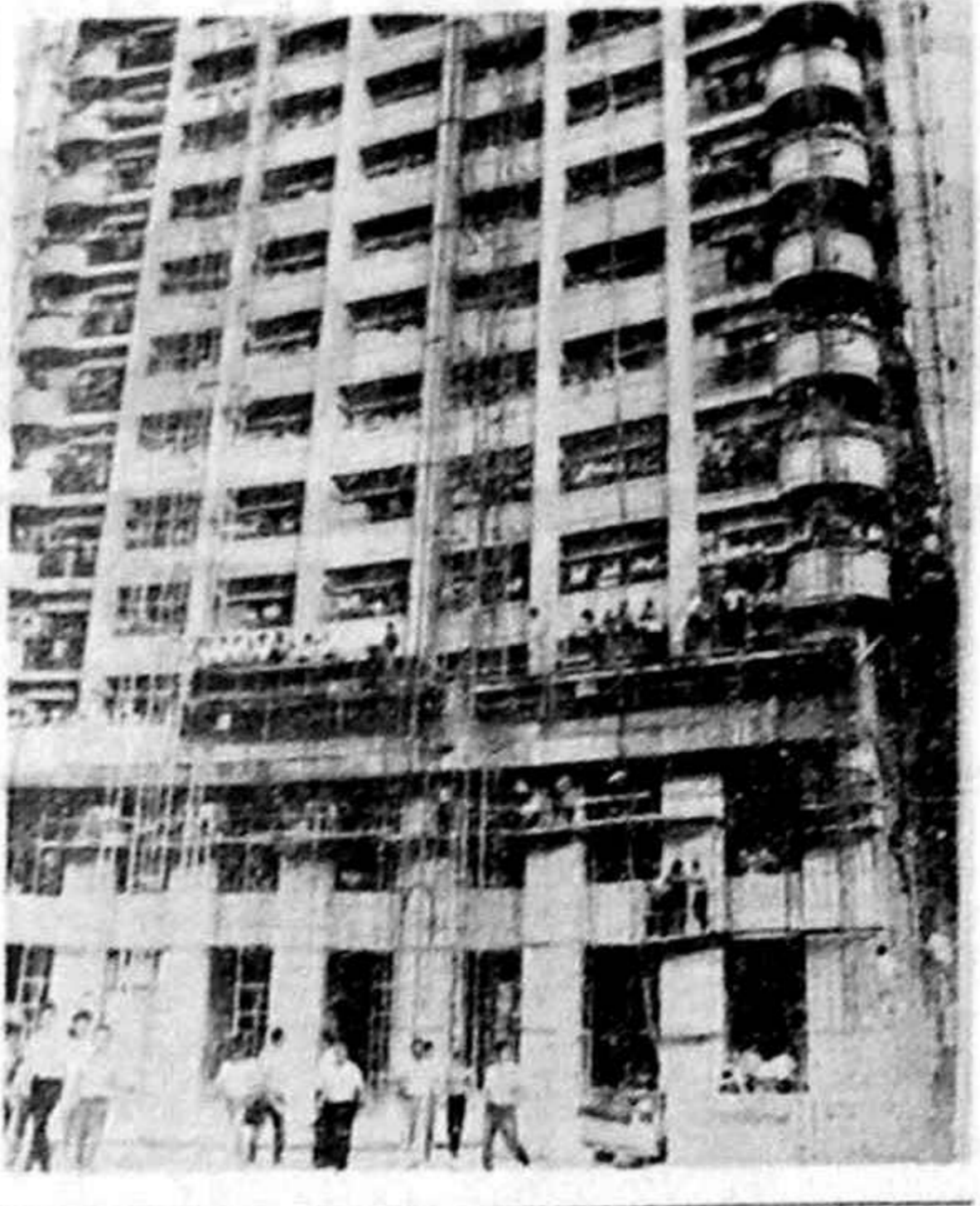
Padeș - 1990