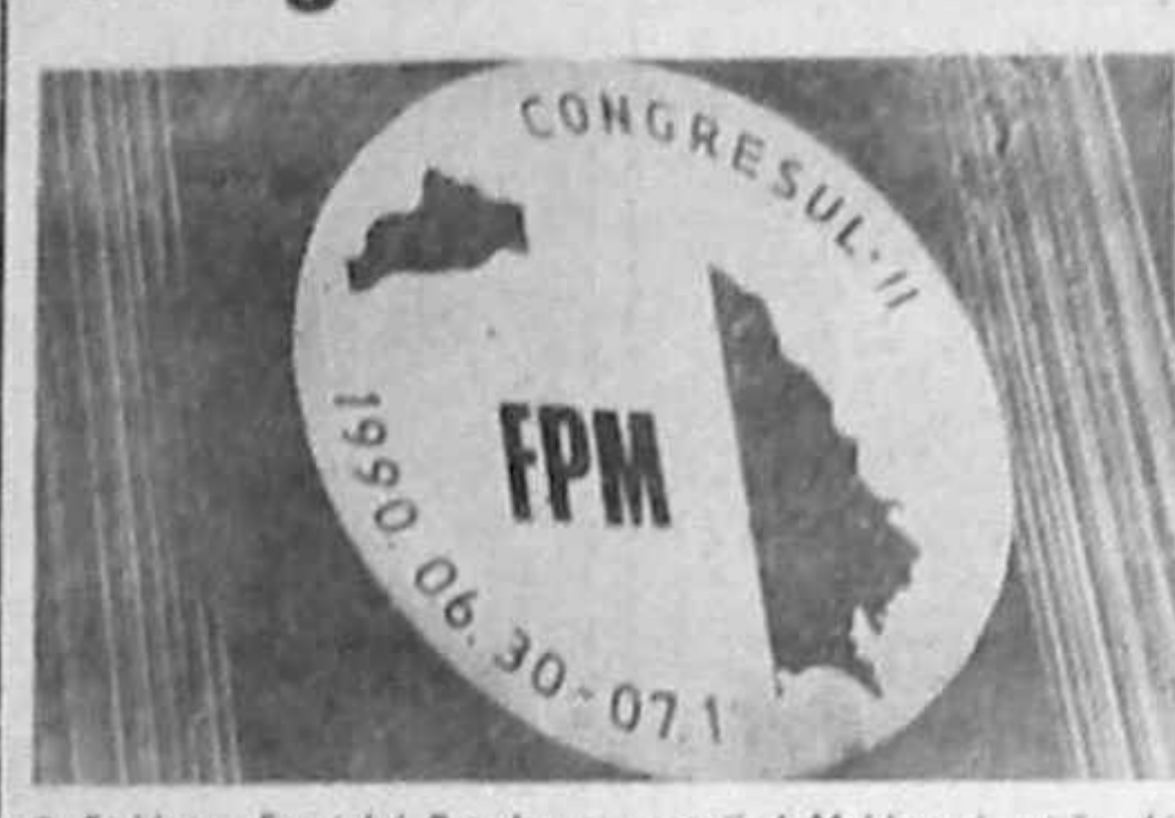
Emblema Frontului Popular reprezentând Moldova în străvechile ei hotare