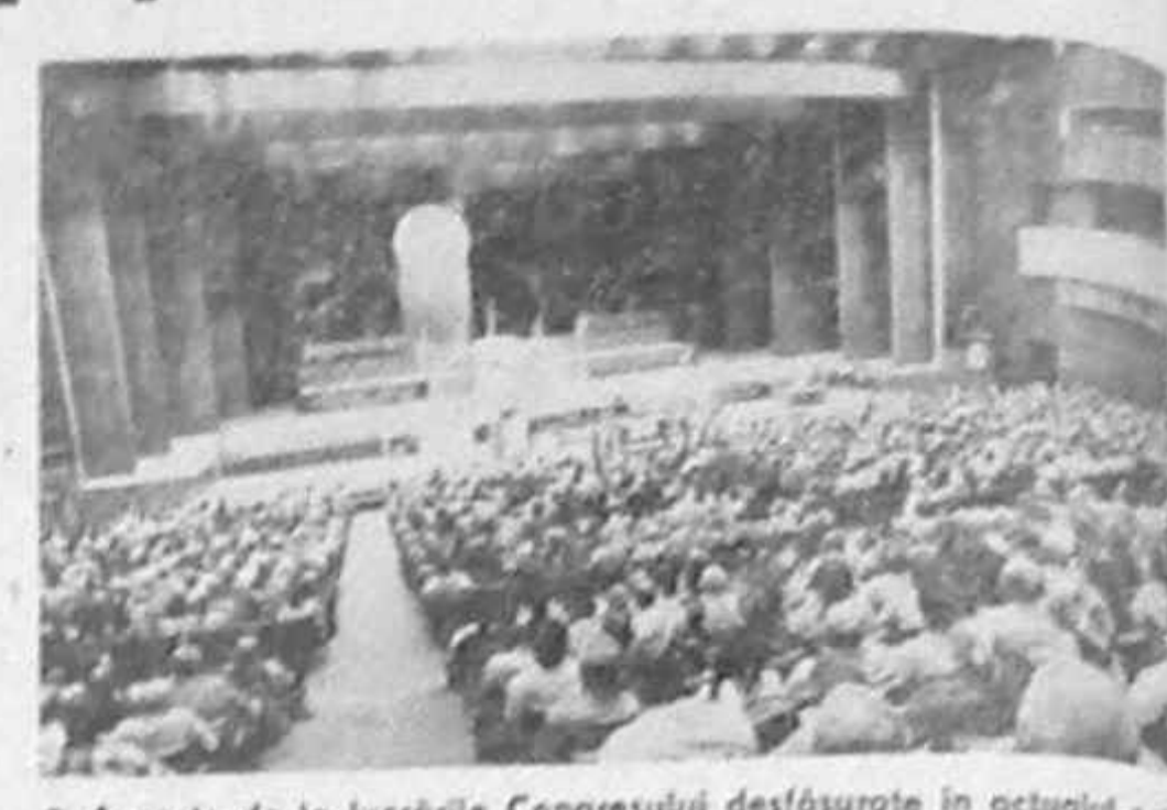
Aspecte de la lucrările Congresului desfășurate în octombrie 1989, viitorul palat național „Moldova”