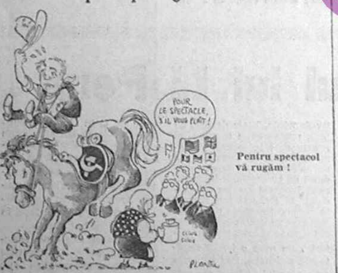
Cei șapte divizați în ceea ce privește ajutorul către U.R.S.S. și asupra politicii agricole a Comunității Europene