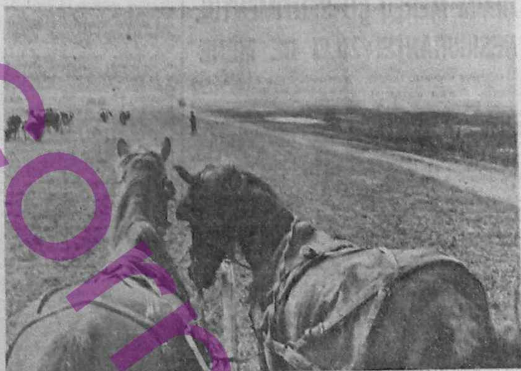
Care cine ține acum hățurile?