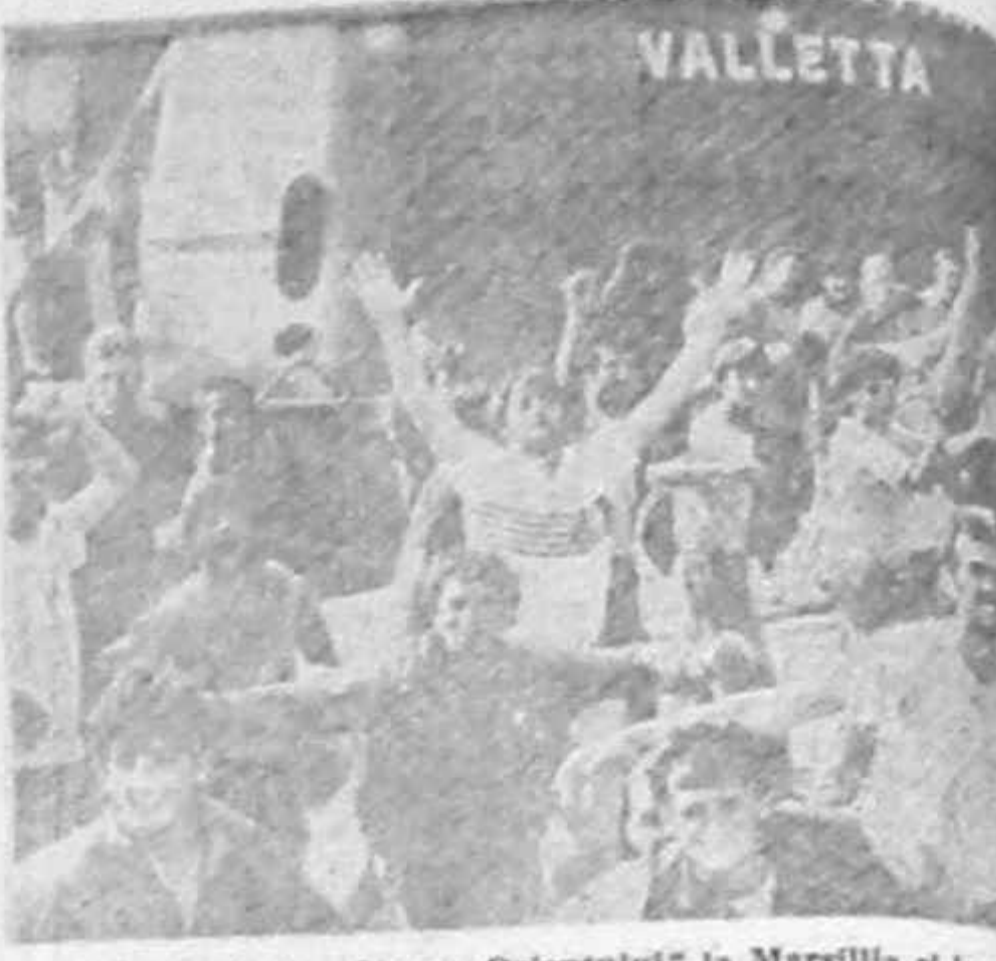
În primul exod albanez în masă, refugiații navighează spre libertate, peste strimțoare, la Brindisi