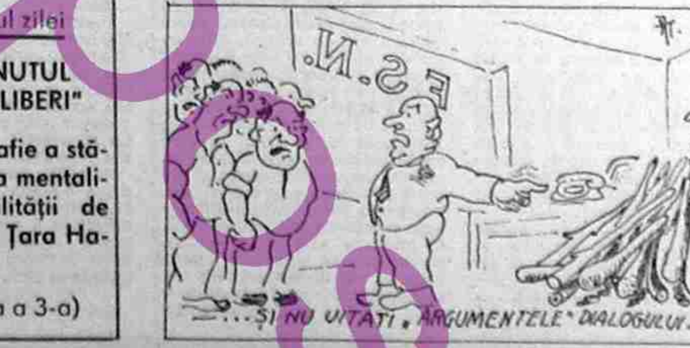
...SI NU UITATI ARGUMENTELE DIALOGULUI...

"PRIN ȚINUTUL DACILOR LIBERI" O radiografie a stării de spirit, a mentalității și mobilității de conștiință în Țara Hațegului. (In pagina a 3-a)