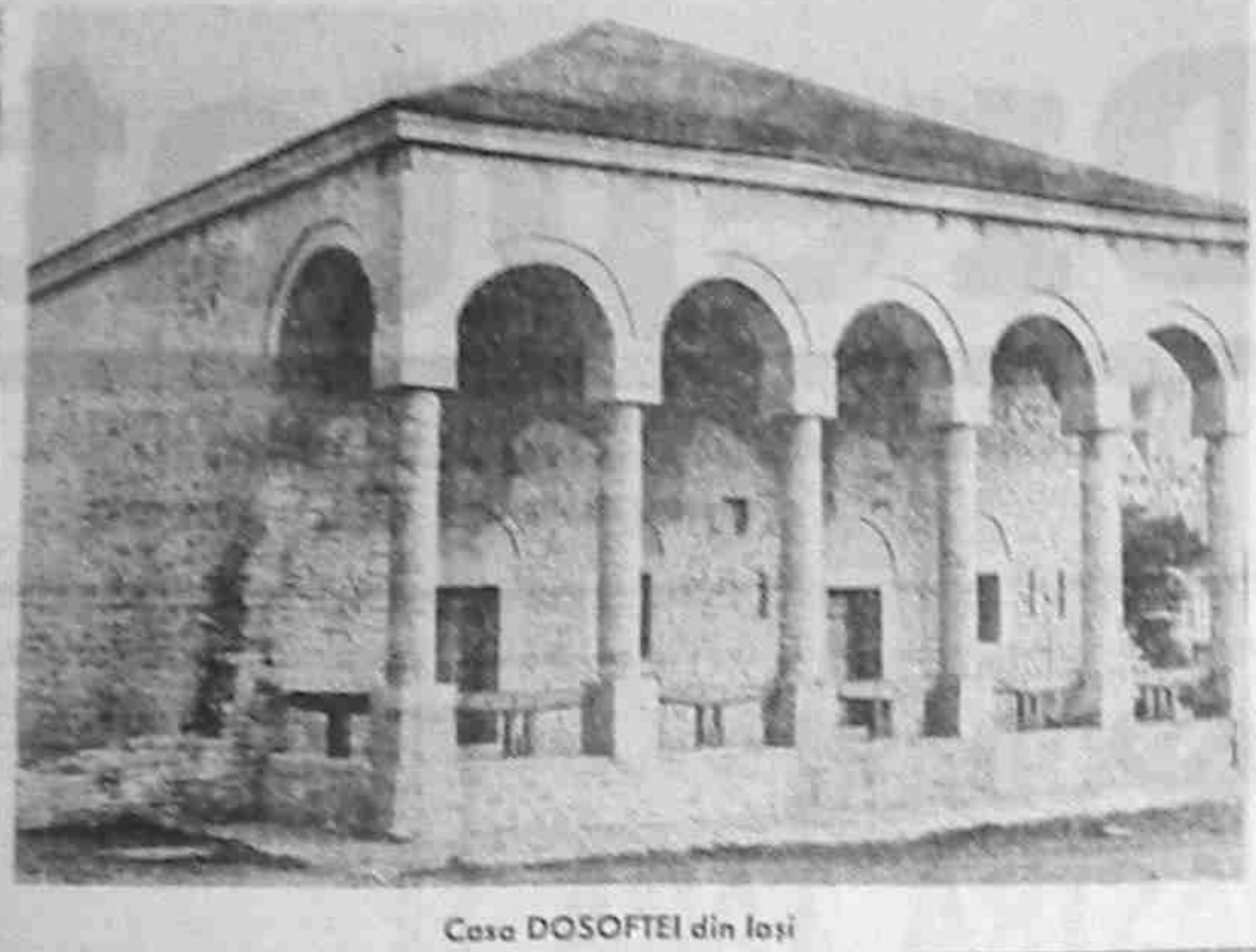
Case DOSOFTEI din Iași