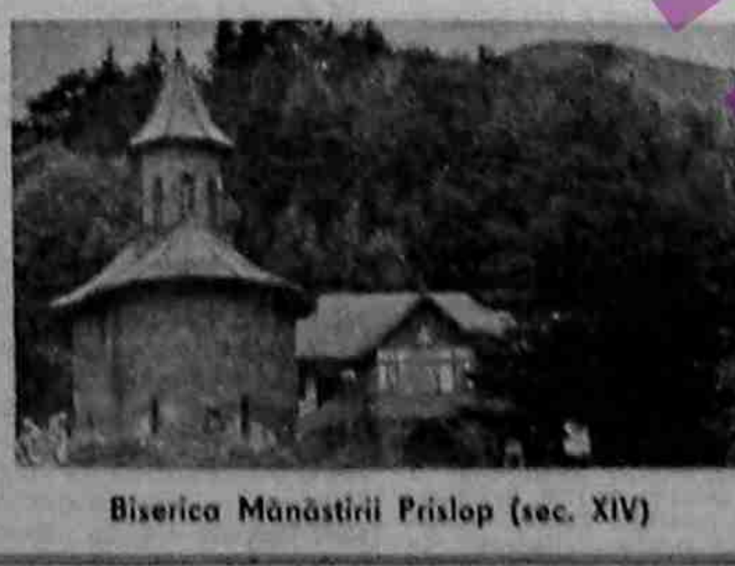
Biserica Mănăstirii Prislop (sec. XIV)

Reportajul zilei DUMINICA HUNEDOREANĂ (stări de spirit, fapte și locuri din orașul de pe Cerna) (În pagina a 3-a)