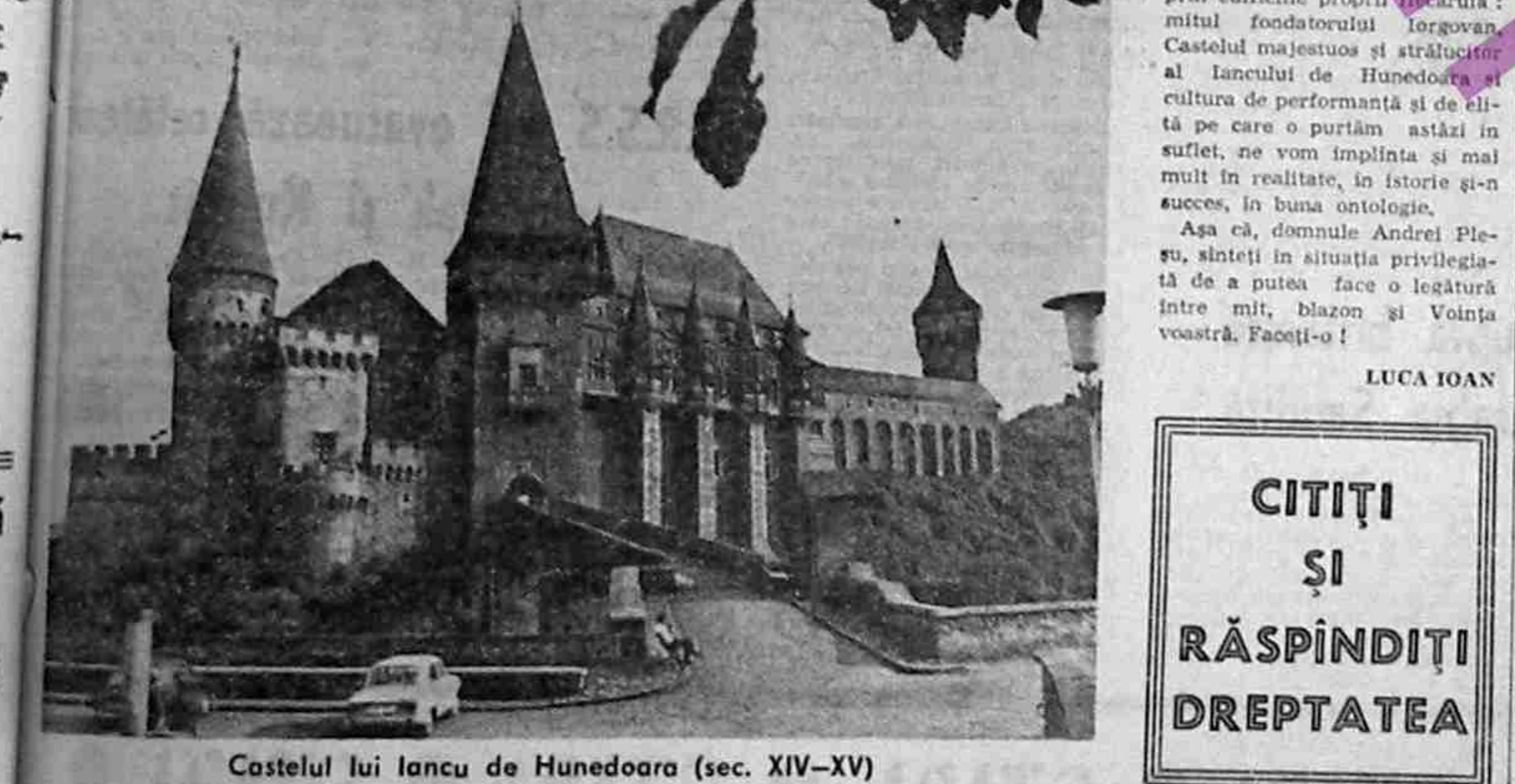
Castelul lui Iancu de Hunedoara (sec. XIV-XV)