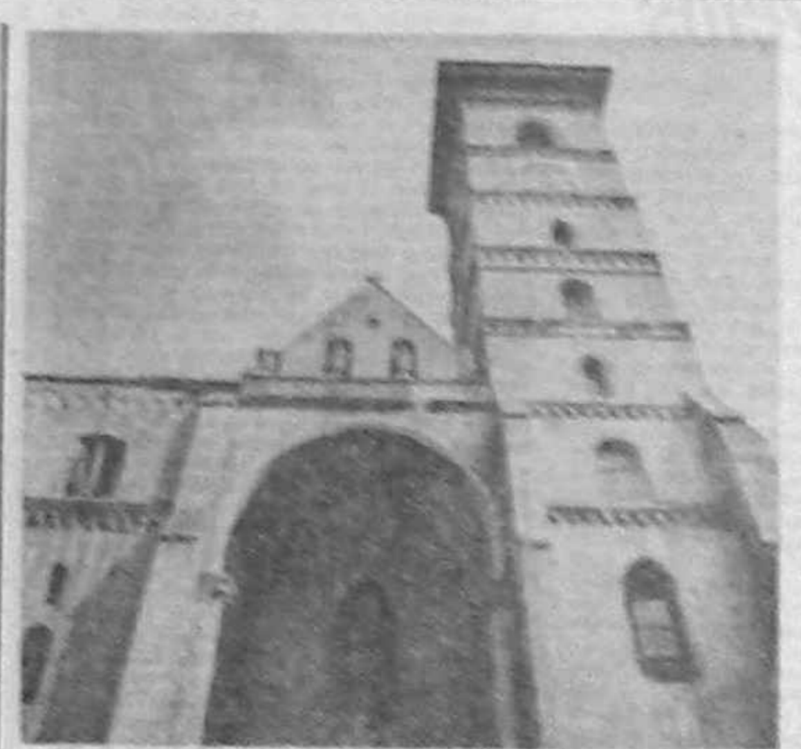
Alba Iulia: Catedrala romano-catolică în care este mormîntul lui Meteu Corvin.