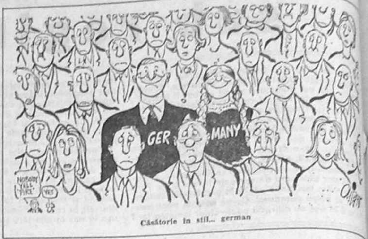
Căătorie în stil... german