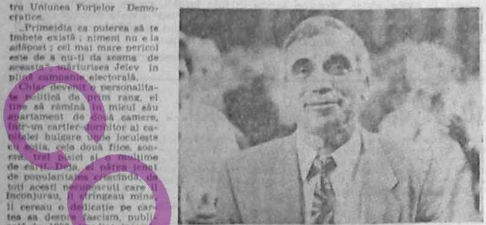
Jelev: „Nu există politica fără principi etice”