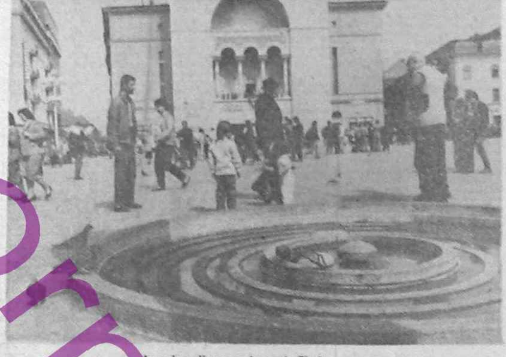
Imagine din orașul martir Timișoara