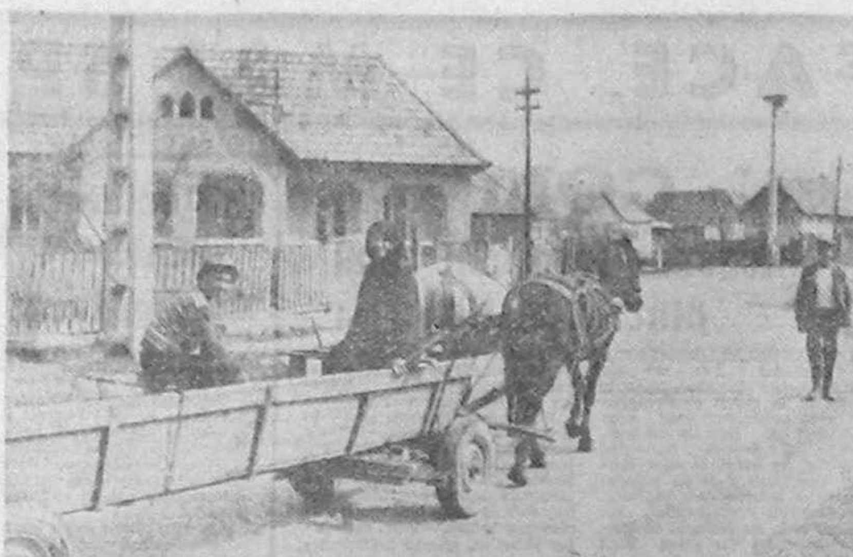
Județul MUREȘ, comuna IBANEȘTI

ra familiile de grăniceri. — In schimbul serviciilor, au primit in plus dreptul de a lua in posesie terenul de familie sau terenul pe care s-a construit casa, precum și alte drepturi în domeniul agricol. ra familiile de grăniceri. — In schimbul serviciilor, au primit in plus dreptul de a lua in posesie terenul de familie sau terenul pe care s-a construit casa, precum și alte drepturi în domeniul agricol.