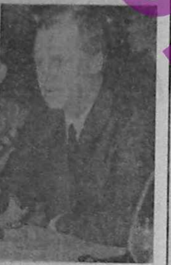
Rijkov nu vrea să pună în aplicare un plan de reforme economice la care n-or ști să adere. Impas!

Dacă Gorbačov nu se ajunge la o înțelegere cu Elnin, luna viitoare economia sovietică va deveni mult confuză. Chiar dacă cel din urmă va stabili-leasă un program comun, perspectiva atlată în fața consumatorilor sovietici nu poate fi optimistă. Acesta este produsul delictului a apăsării și pierderii. Indiferent de exactitudinea datelor, lipsa pieții de pe piață coincide cu un an în care recolta de cereale din URSS a atins un nivel record. (S. MOISESCU)