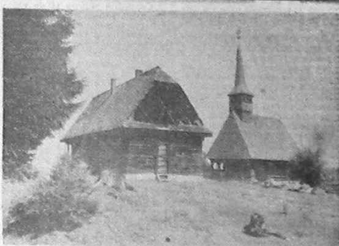
Biserica de lemn din Belș - Tara Moșilor - jud. Cluj