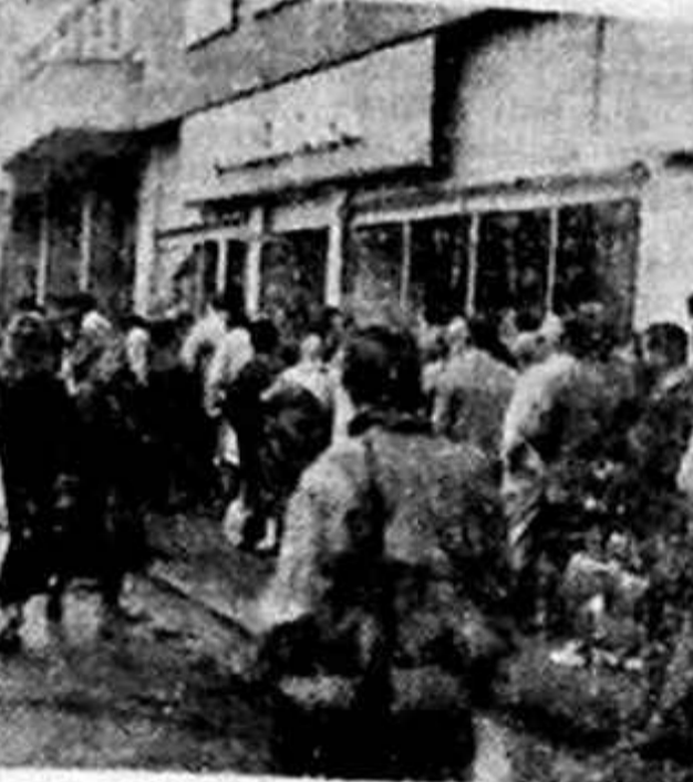
Aici „se dă” ceva... Cumva carne tocată de mic?