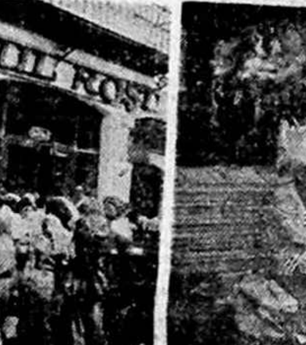
„Macul roșu” s-a adus până. Mai mare eveniment decât se putea în viața bucurărilor ajunse... descuși.