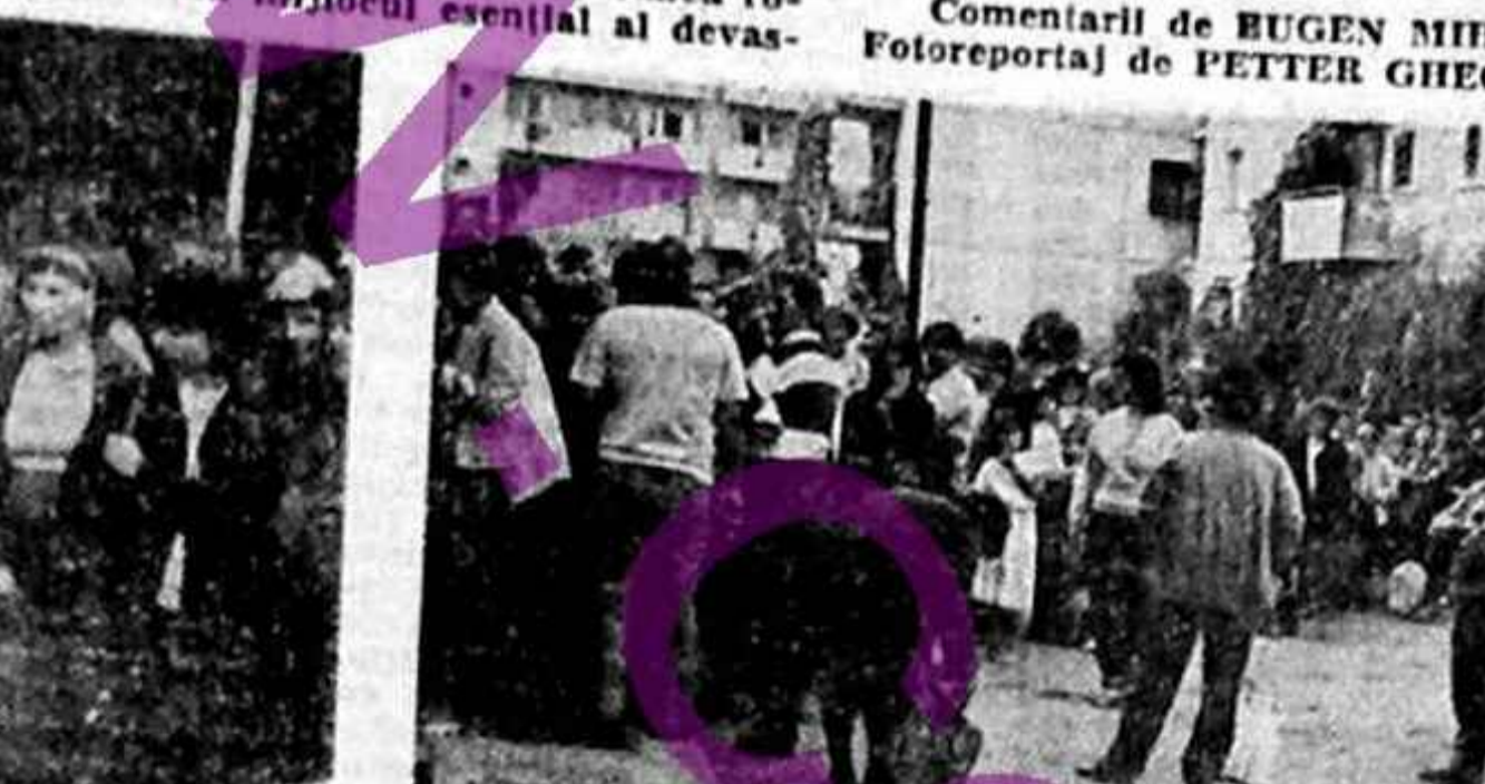
O bistă bucurie a călătorului gospodăru: s-a adus ojet!