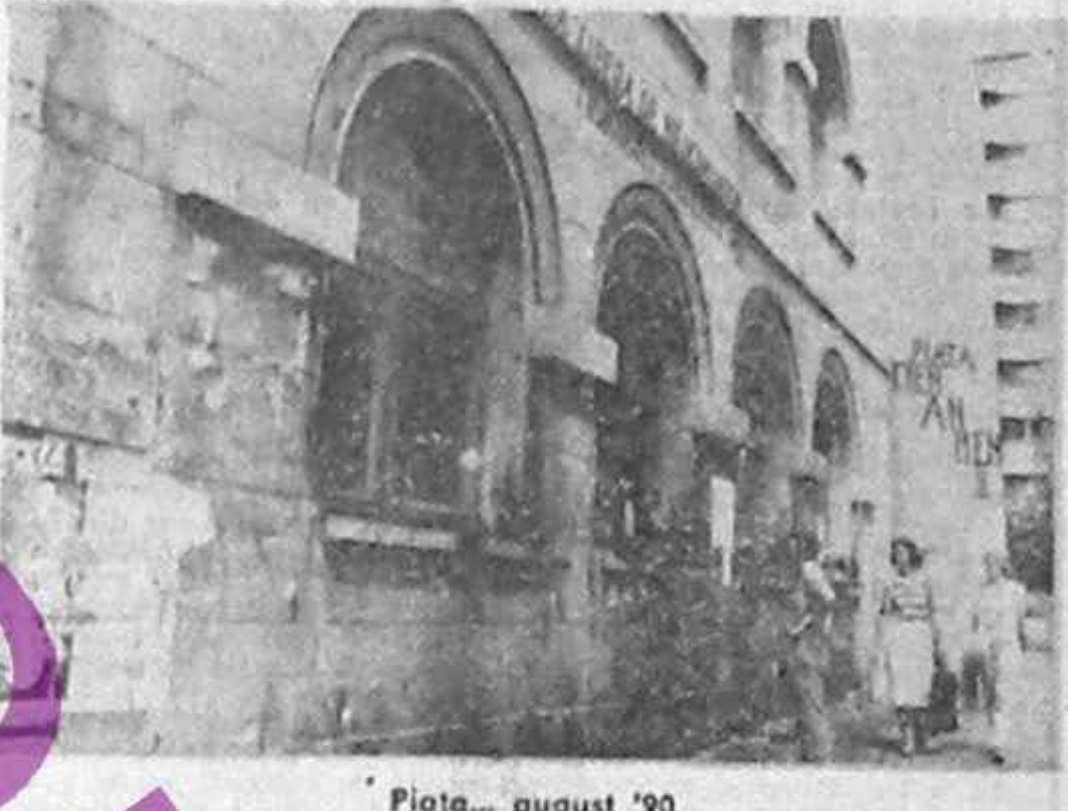
Piața... august '90