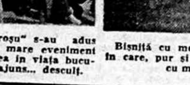
Bisniță cu mere într-o țară în care, pur și simplu, plouă cu mere...