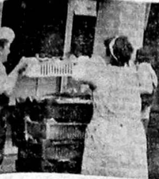
Coadă la oase în Piața Amzei.