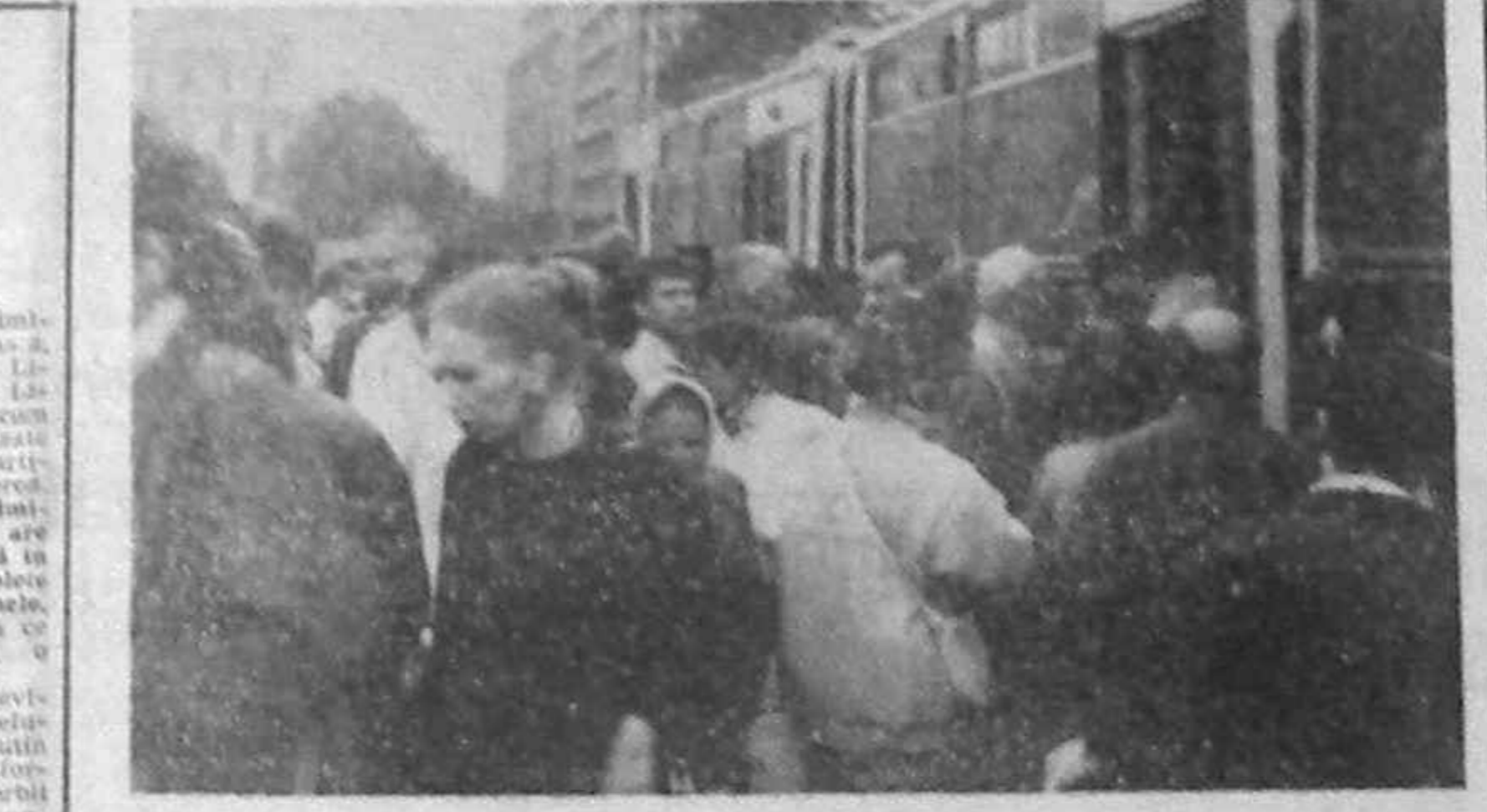
China noastră cel de toate zilele

cravată la gât, în costume civile, cerind să fie judecați în libertate, cerind îngrijiri medicale deosebite și hrană pe gustul lor, lini muncitorilor, elevii, studenții participau în spatele gratiilor pentru simplul fapt că nu au acceptat să fie frustrați de idealurile pentru care au luptat. Acești tineri delinquenți politici sînt închiși în celule împreună cu delincvenți de drept comun, au fost și sînt maltratați de către organele de pază, sînt aduși la judecată în zgomot, murdare și urit mirositoare, au fost roși în cap, lor despre mîncarea ce li se dă se spune că nu ar mînc-o nici cîini de pază.