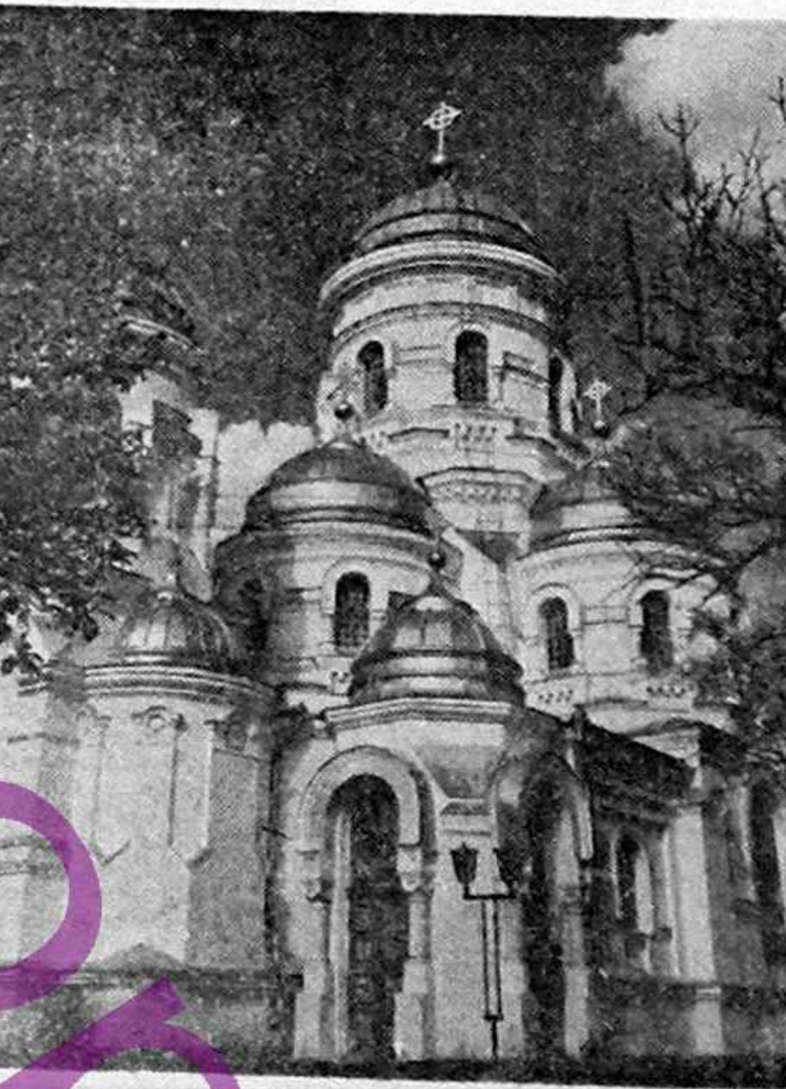
Mănăstirea Căpriana, Republica Moldova