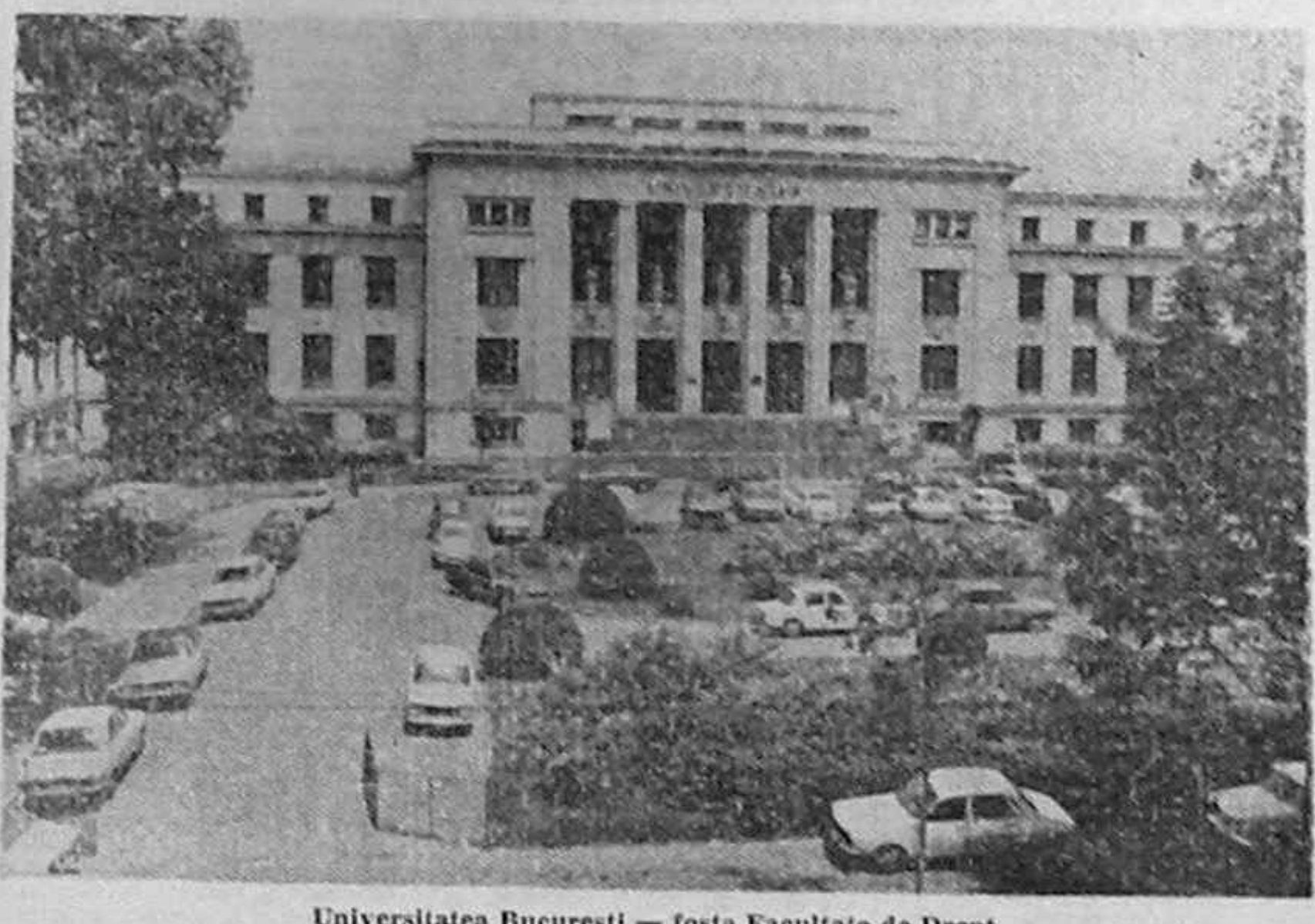
Universitatea București — fosta Facultate de Drept