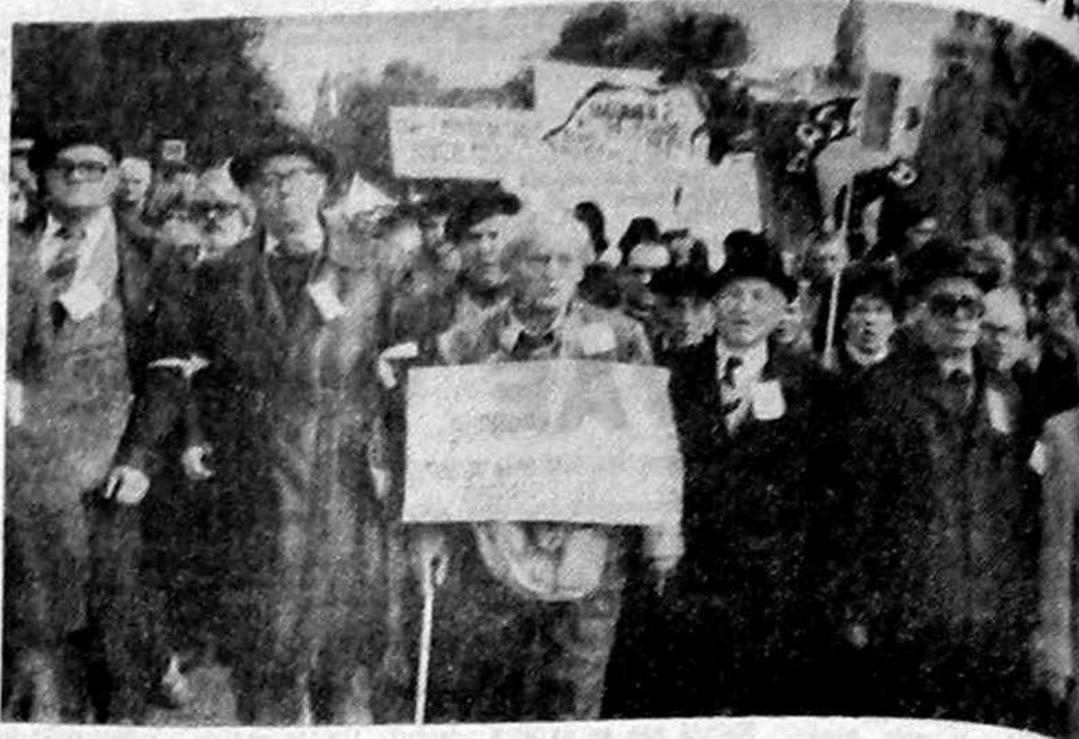
Vineri 26 octombrie s-a desfășurat în Capitală un marș de protest...