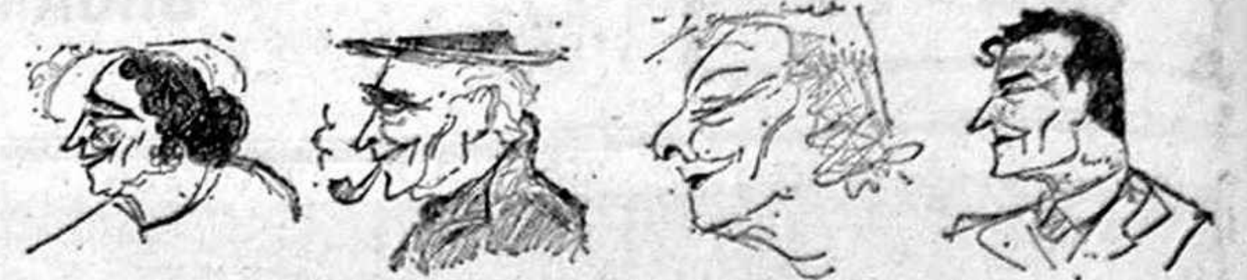
Portrele executate de autorul scrisorii