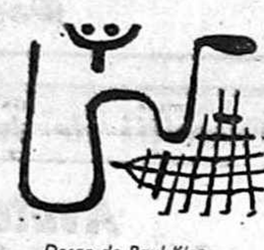
Desen de Paul Klee

Nu mai pot îndura, nu mai pot suporta nimic, nimic, nici măcar pe mine însumi. Aș vrea să nu fi existat niciodată în această lume sau în alta, aș vrea să nu fi avut nicodată spațiu, carne, simțuri gînduri, să nu fi apucat să las prietenii și amintiri, cărți și camere goale, fragmente din vîrduhul unor țări străine, să nu fi fost agent al speranțelor și deășărilor lumești, goigheter și apărător ai vreunei cauze, să nu fi murdărit pleoape și ochelari, să nu fi ains pielea niciunei fete, să nu fi traumatizat și-nseninat zilele nici unor părinți, să nu fi antrenat viața vreunor muritori în cel mai mic vîrtej, lășindu-i să și-o ducă, pură sau impură, acolo unde se duc toate viețile, eu rămînid fără calificative acolo unde rămîn toate non-viețile, eu rămînid în Poezia resurselor infinit nedesvăluite, în pulverulenta fecundă a non-lumilor, în infinitudinea electronului nedevenit cuvînt.