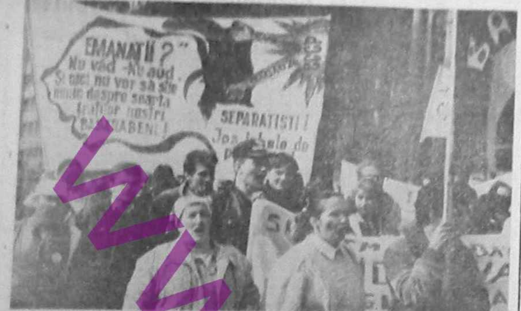
În întreaga țară și în Capitală au continuat manifestațiile în legătură cu mișcarea separatistă a găgăuzilor și nistrinilor din Basarabia...