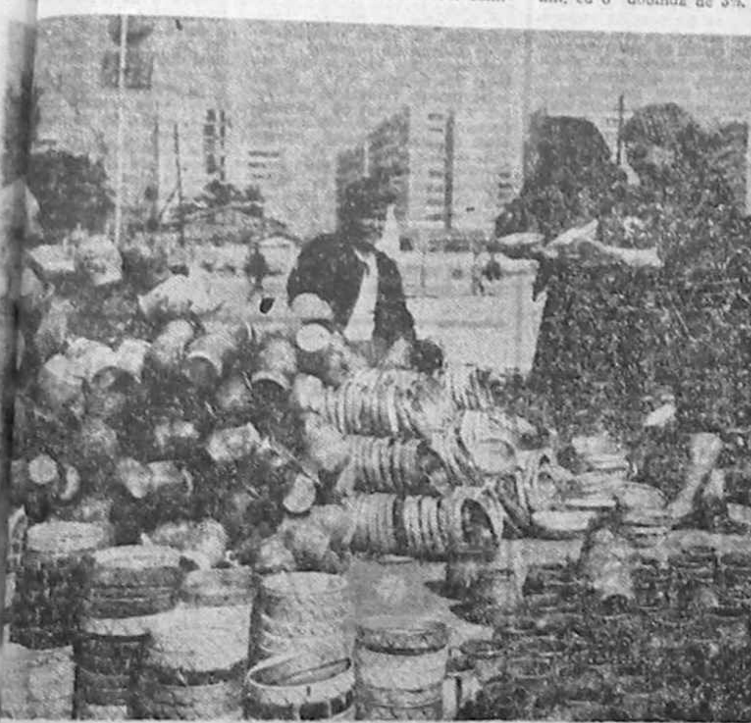
Un car de oale și... octuola „Reformă” din România.

În parlament, opoziția aduna din nou, prin tratativele din 1932, a fost adoptată de parlament. Prezentul proiect pe scurt, prezintă o serie de modificări importante care a stăruie în discuție în acest proiect. Este vorba de un proiect, nu numai de o ofertă, ci de o inițiativă de departament, din partea Departamentului de Agricultură, care a fost prezentată în cadrul sesiunii de lucru a Camerei Deputaților (comisia de lucrații civile, finanțară și bugetară) unde au fost analizate cu larg domeniu și prevederile proiectului. Este un proiect care ar trebui avut în vedere în cadrul proiectului actual și în cadrul proiectului de lege privind conversiunea datoriilor agricole. De asemenea, în cadrul sesiunii de lucru a Camerei Deputaților (comisia de lucrații civile, finanțară și bugetară) unde au fost analizate cu larg domeniu și prevederile proiectului. Este un proiect care ar trebui avut în vedere în cadrul proiectului actual și în cadrul proiectului de lege privind conversiunea datoriilor agricole. De asemenea, în cadrul sesiunii de lucru a Camerei Deputaților (comisia de lucrații civile, finanțară și bugetară) unde au fost analizate cu larg domeniu și prevederile proiectului. Este un proiect care ar trebui avut în vedere în cadrul proiectului actual și în cadrul proiectului de lege privind conversiunea datoriilor agricole.