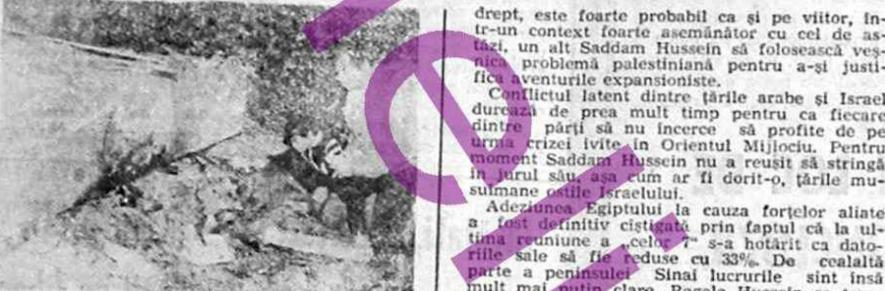
Ruinele unui imobil din Tel-Aviv