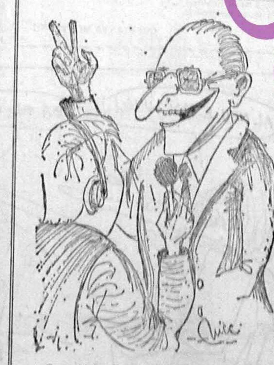
— Cum e în America d-le preşedinte? — Ca la noi. Cine are dolari o ducă foarte bine.

De ce n-a fost „Dreptatea“ în China? De ce n-a fost „Dreptatea“ în China? De ce n-a fost „Dreptatea“ în China? De ce n-a fost „Dreptatea“ în China?