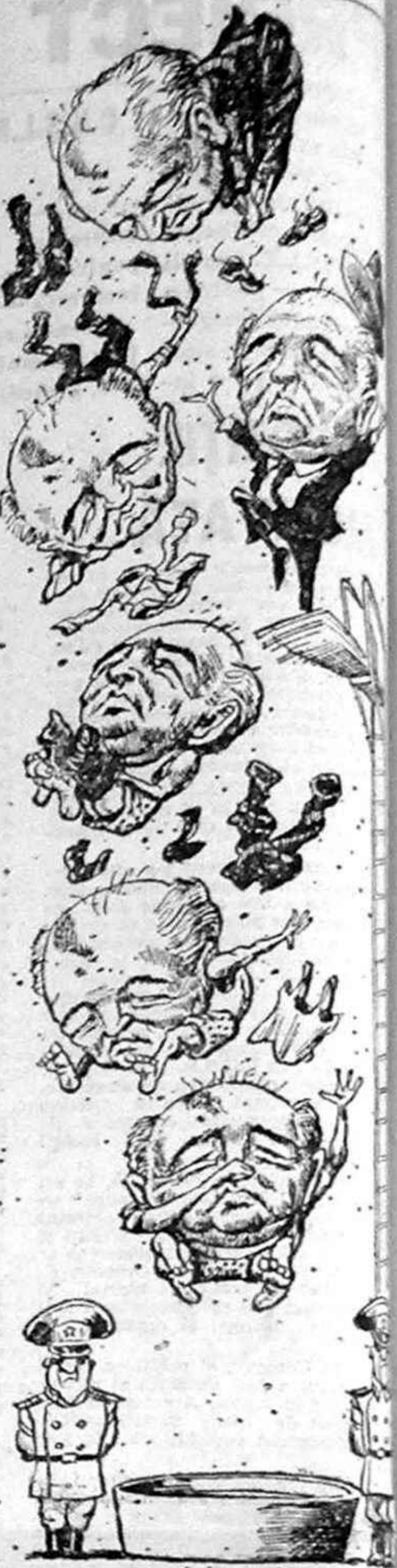
după „The Economist”