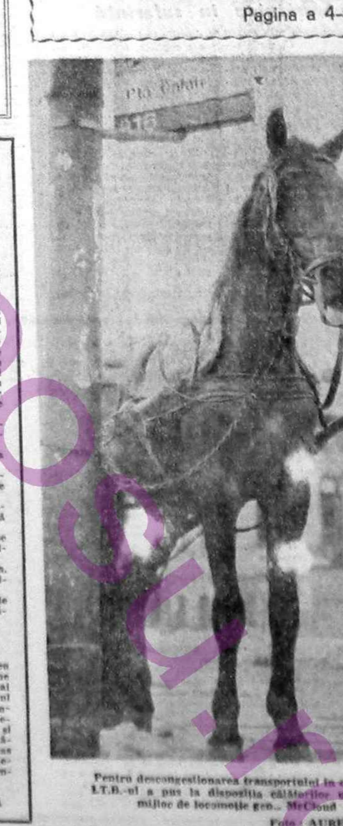
Probleme de transport în comuna LTB. Ul a pus la dispoziție câștigătorii un nou mijloc de locomotivă gen. MeClond