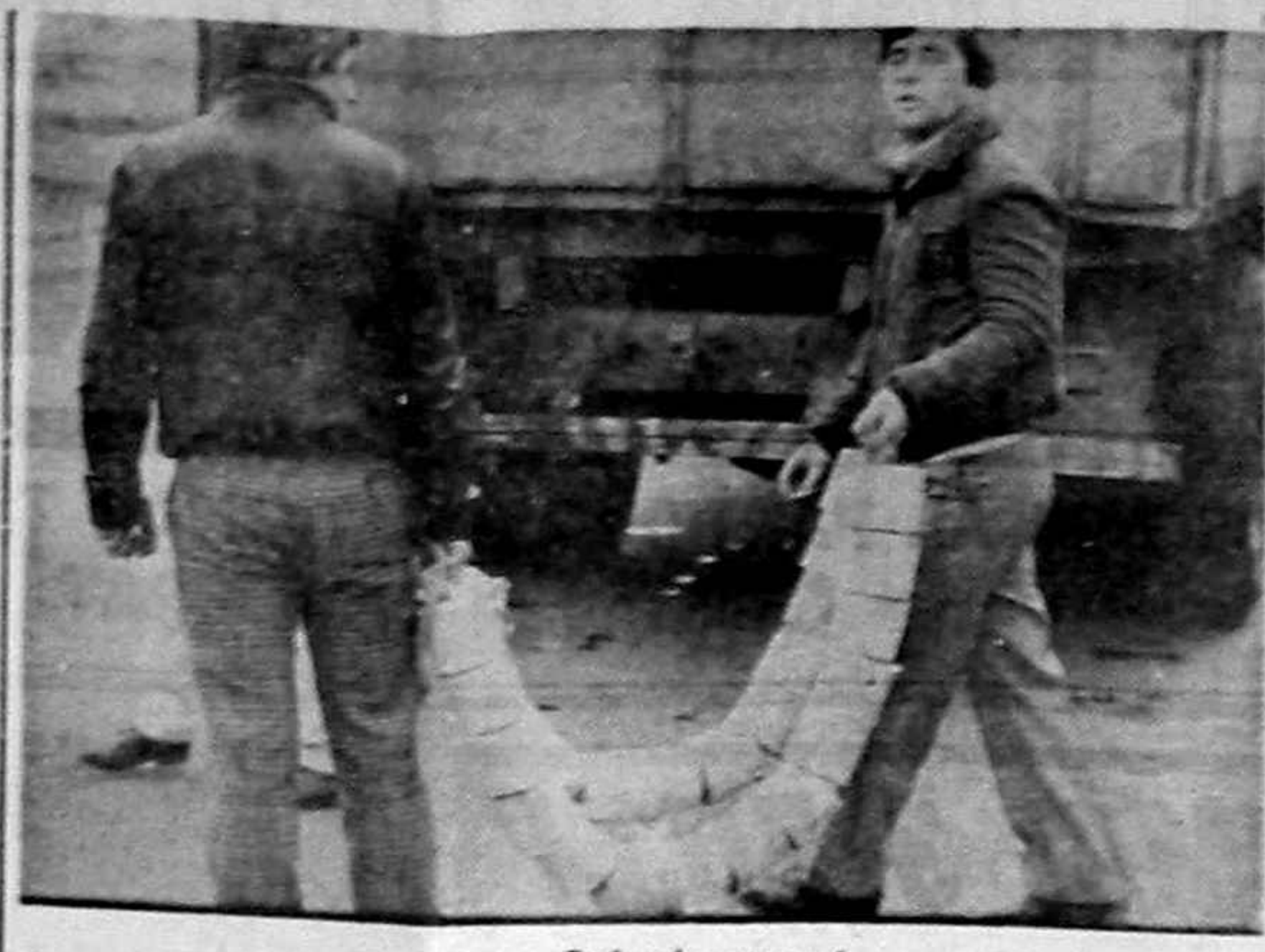
Troiea de mare preț