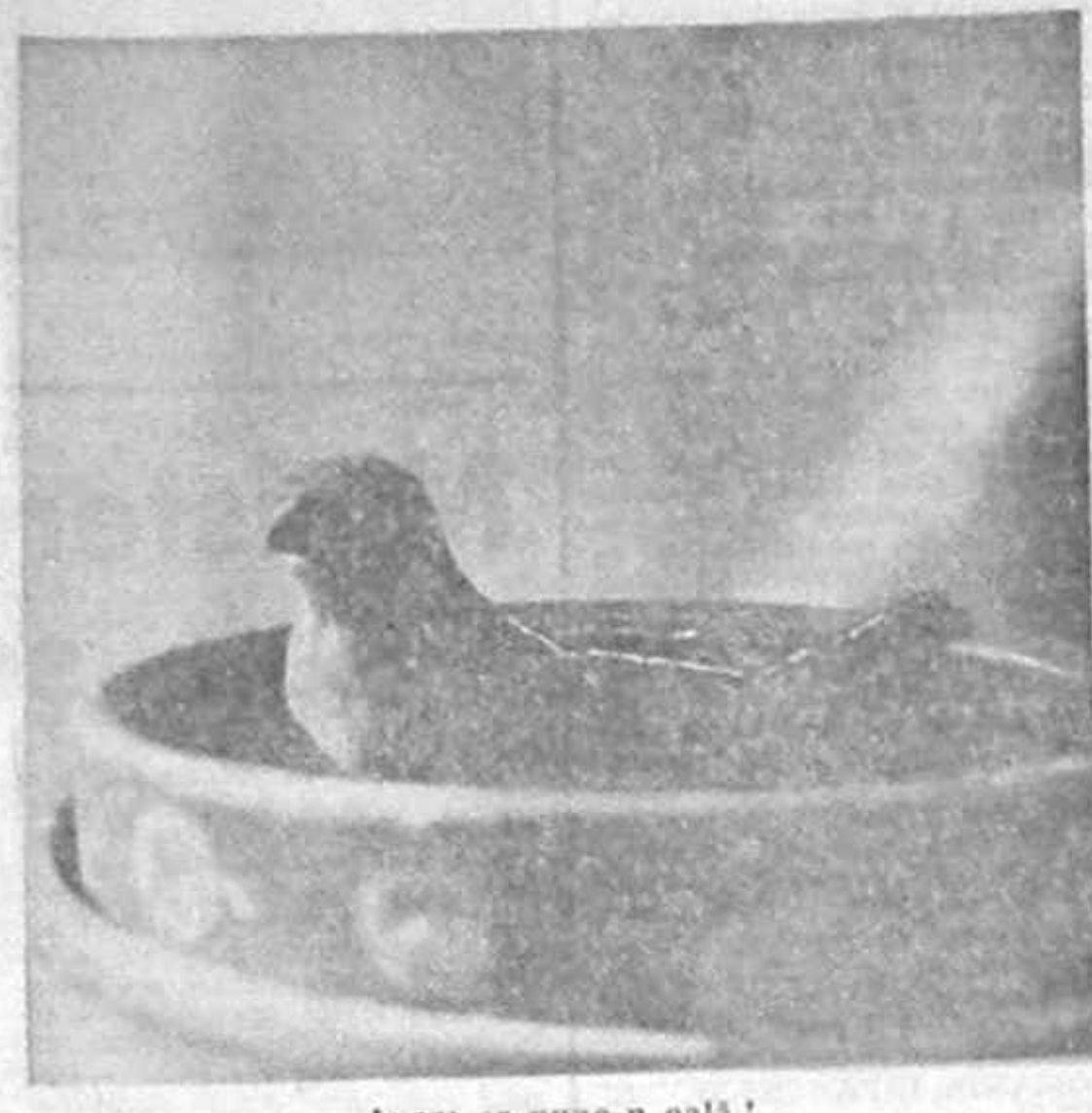
Aveni ce pune-n oală!

Cartelul Sindical Alfa organizează astăzi, 20 martie, începând cu ora 15, un marș pe traseul Piața Revoluției, Piața Unirii, Palatul Cotroceni, la care cheamă pe toți membrii sindicatelor sale, pe toți cetățenii țării. Scopurile acestei acțiuni sînt: oprirea imediată a aplicării fazei a doua a liberalizării prețurilor și susținerea alternativei „Alfa” pentru o Românie democratică și reunită.