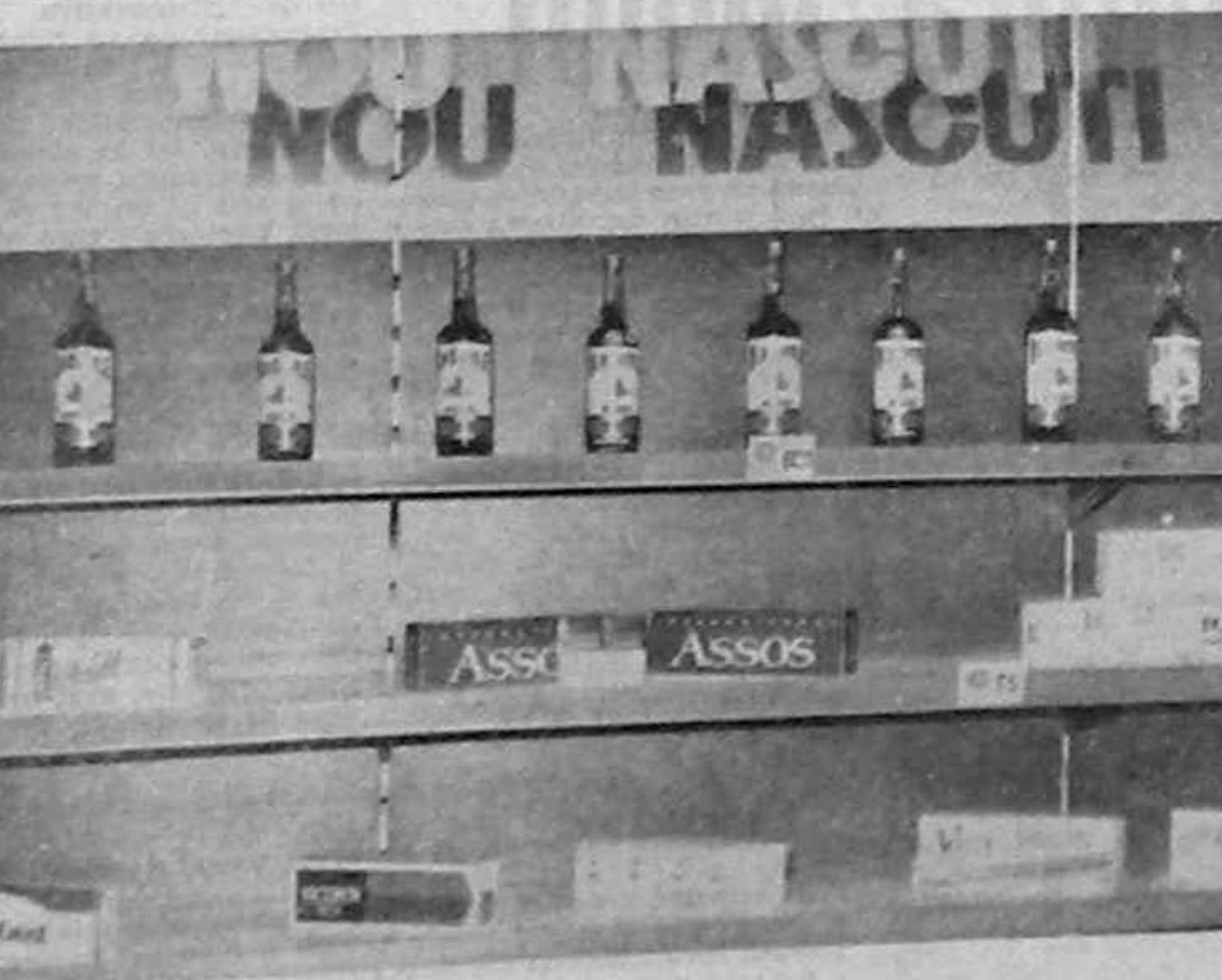
Fără comentarii!

Convenția națională a FSN s-a încheiat fără surprize. Dl. Iordache, demisionat cu câteva zile înainte, a fost desemnat din nou Președinte al FSN. Poate că d-ns stia ce urma și a părăsit scena la vreme. Nici alegerea d-lui Stoica în funcția de președinte executiv nu e de mirare. Demisionat din guvern luna trecută, dl. Stoica ar fi avut acces eventual la punerile, doar că acesta și-a rezolvat la judecătorească instanță problema. Ar fi și o dovadă că dl. Roman îl jubeste pe timp de ardeleni, preferându-l pe dl. Stoica băneanului Iordache. Nimic nu alina în această Convenție. Tot ce s-a spus în chip demagogic în ultimul număr e-a repetat și acum: rămâne de văzut dacă de data aceasta vorbele vor fi urmate și de fapte. Dacă dl. Roman va semna în continuare această referitoare la „delictele” de presă, atunci nădejdea noas-