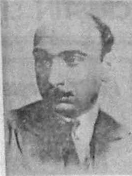
Centenarul nasterii lui Ion Pillat (1891-1991)...

tre. Culeterind tara in luna si lat, Ion Pillat si-a dat seama...