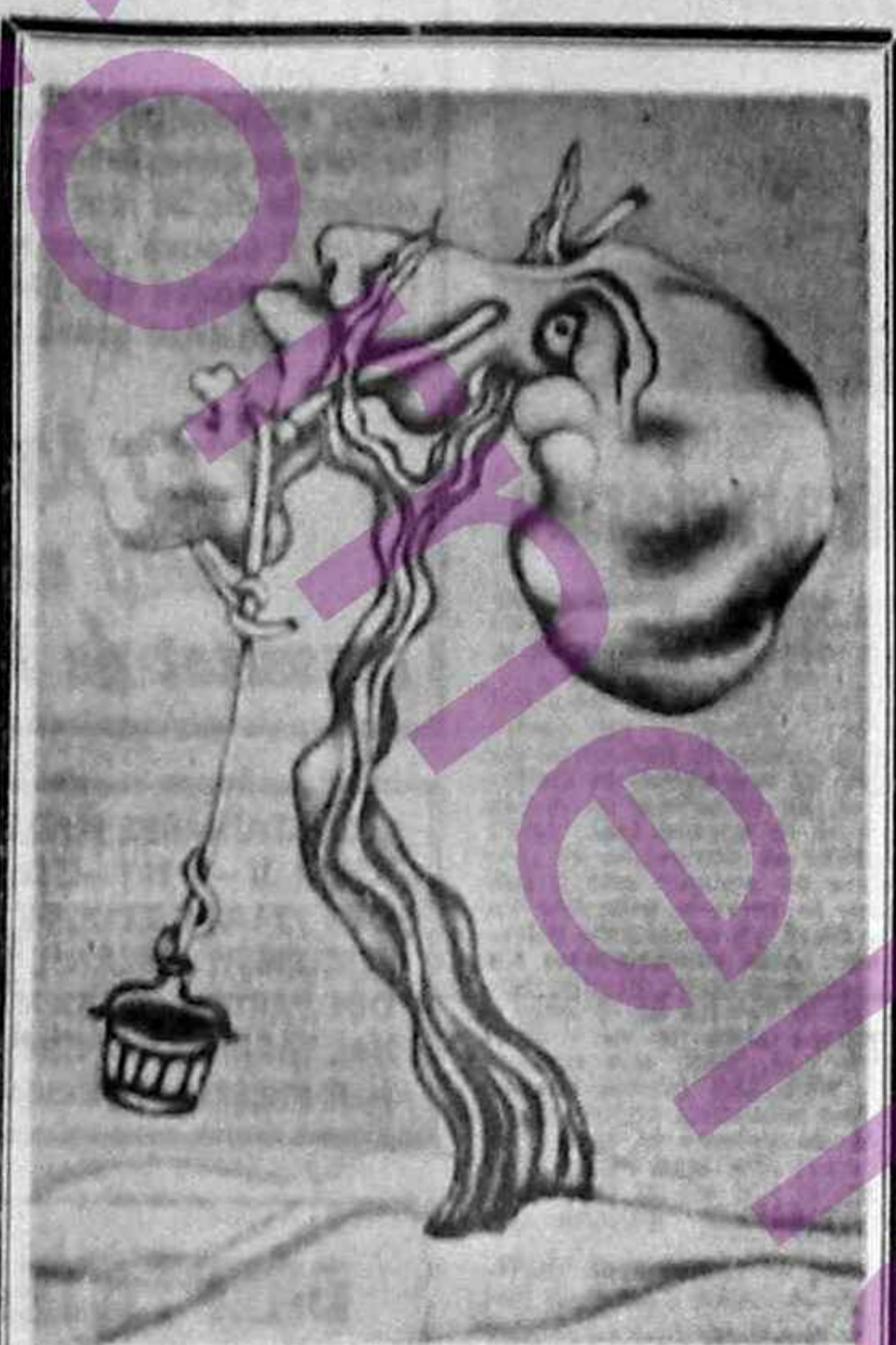
ION PUIU (Basarabia) - compoziție