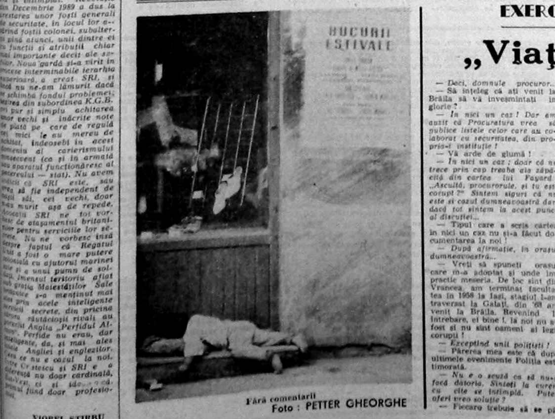
Fără comentarii