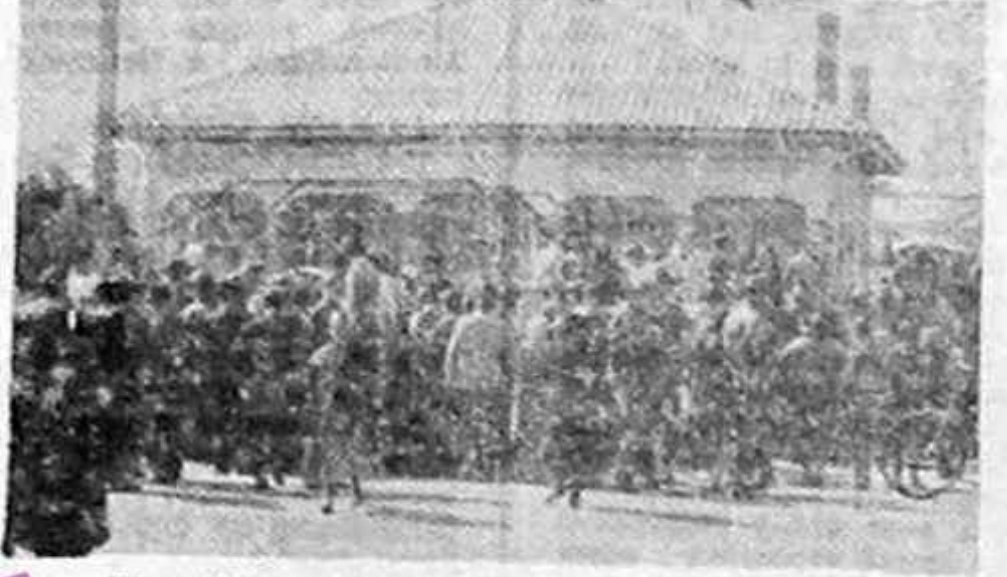
Țărâni, cu sutele, în fața ceapului din Găiseni