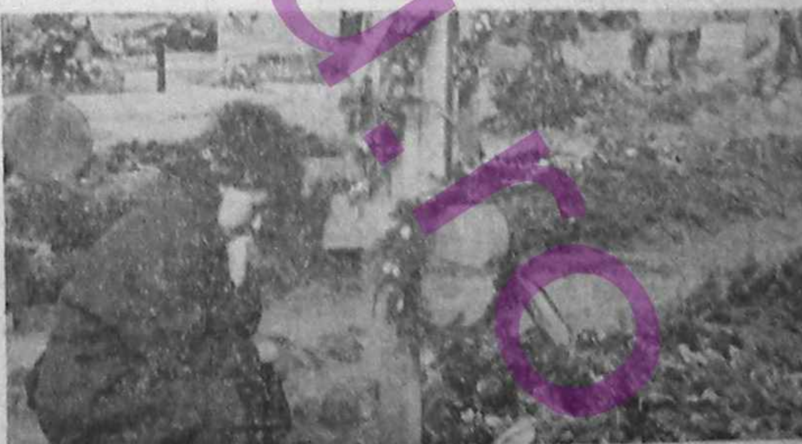
Lacrimi pentru eroii Revoluției

GEORGE POPESCU GRU (Continuare în pagina 4-a)