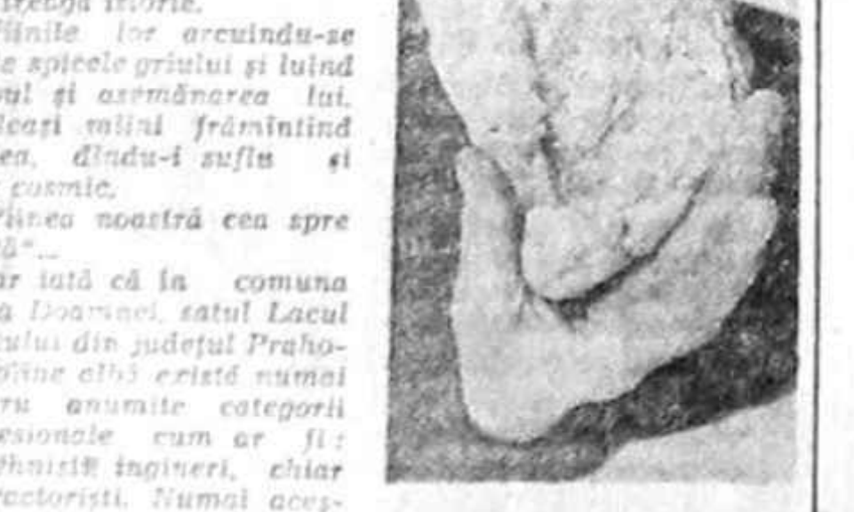
gazin să-și cumpere pîinea? Unde sînt vremurile cînd cuporul era punctul important dintr-o gospodărie — un fel de axis mundi — iar fiecare casă te îmbia cu mirosul proaspăt și pufoș al pîinii albe și rumenite?

Mîinile lor sînt crăpate de durerea și truda răpită din pământ. Mîinile aspre, bătătoare, chimuite și îmbătrînite mult prea devreme. Mîinile ce adună în ele o întregă istorie.