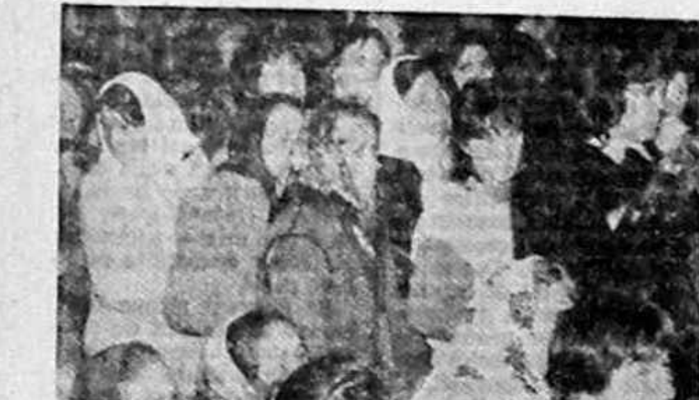
Se discută cea mai importantă chestiune la ordinea... vieții de țărân: pământul!

Primum un apel dramatic din partea oamenilor de la Tobitoria de în din Ploiești, județul Prahova. Sămînța de în stă în magazine și nu mai vine, la acest an, s-o ia nimeni. „Ce ne vom face la toamnă?” se întreabă și ne întreabă ministrul Gheorghe Măgîrescu, 250 de oameni, lucrători unității noastre, vor rămîne fără muncă. Și nu numai atît, dar nu vom mai