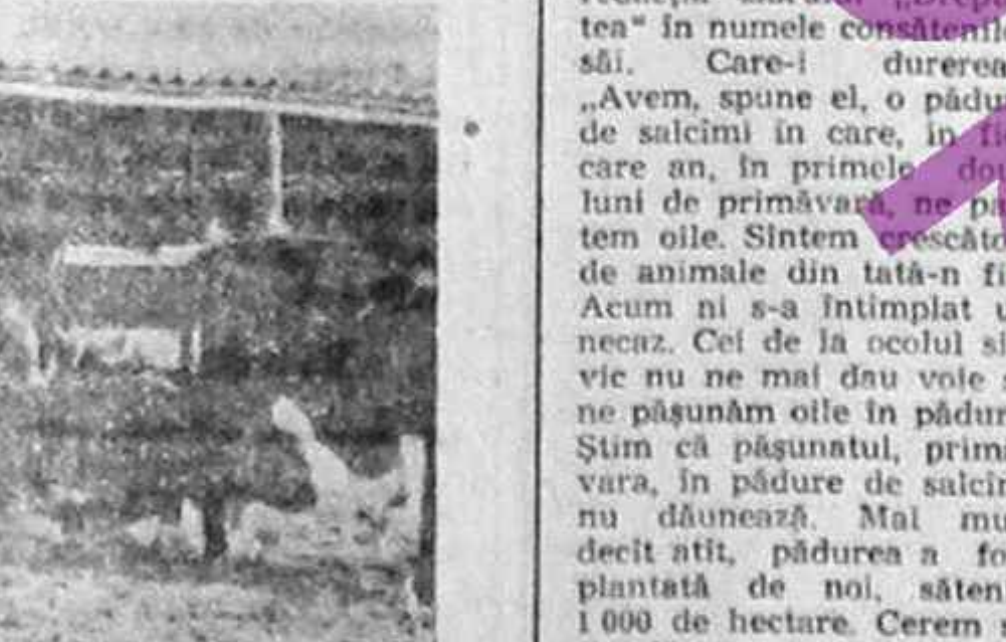
Zootehnia la C.A.P. Găiseni — o Blafra