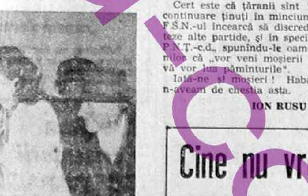
In urma dezbaterilor, țărâni s-au procopsit cu un proces verbal. Noul primar al comunei îl ascultă cu atenție