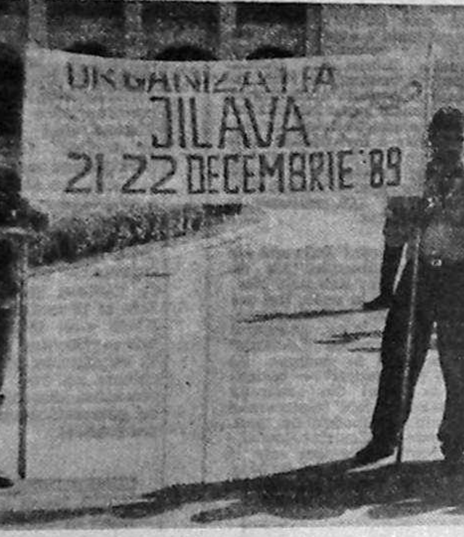
Organizația JILAVA 21-22 DECEMBRIE '89