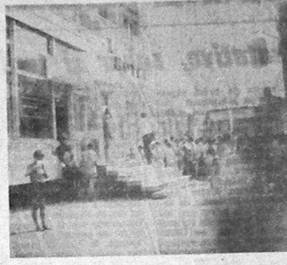
Biznă de maha! Cu negocierile produselor alimentare, textile, electronice și toate cele bune de vizitare. Cumpărătorii, în mare parte țigani (zilțari) sînt cam ațuștași și intr-adevăr nepăsători dar că o treabă organizează de poliție care, sînt, numerose, rețete. Într-o sală spumantă și cu o atmosferă de simpatie și bună înțelegere cu marea masă de turiști din țară și din străinătate.

Starea avansată de degradare în care se află Hotelul „Turist” te duce cu gândul că aici a avut loc recent un seism de proporții. Peretele clemelor hotelului sînt lipsiți de la fiecare „rundă”. Personalul de ordine al hotelului îl privește dincolo și complice, dînd dovadă de o surprinzătoare amabilitate. Programul „pietel” începe de la ore destul de matinalie (aproximativ la 10.00), însoțit de muzică deosebită pentru somnul locatarilor și terminînd cu miezul nopții.