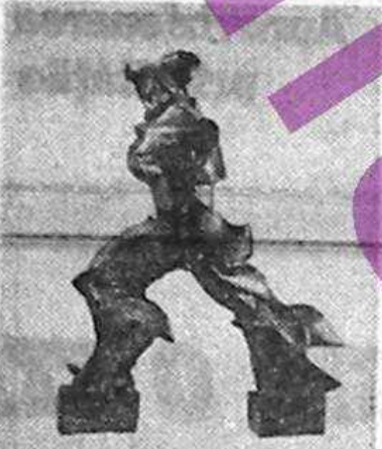
Umberto Boccioni: „Forma unică a mișcării în spațiu”