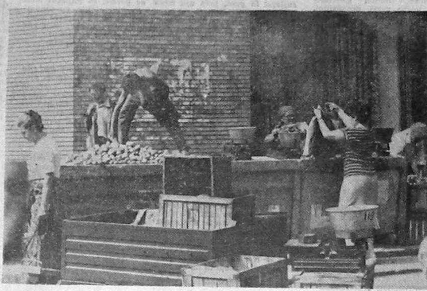
Aprovizionarea populației — una din prioritățile guvernului Stolojan

Corectitudinea alegerilor depinde — în cea mai mare măsură — de o televiziune realmente impar-