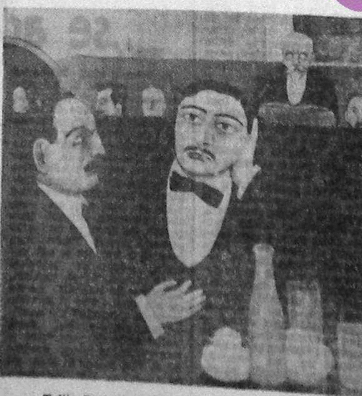
Tullio Barbari (pictură): „Intelectuali la cafenea”

de înabil legate de romanul propriu-zis și dacă n-ar distona alt de puternic cu stilul absolut euceritor în care sînt redactate însemnările doctorului Ruiu.