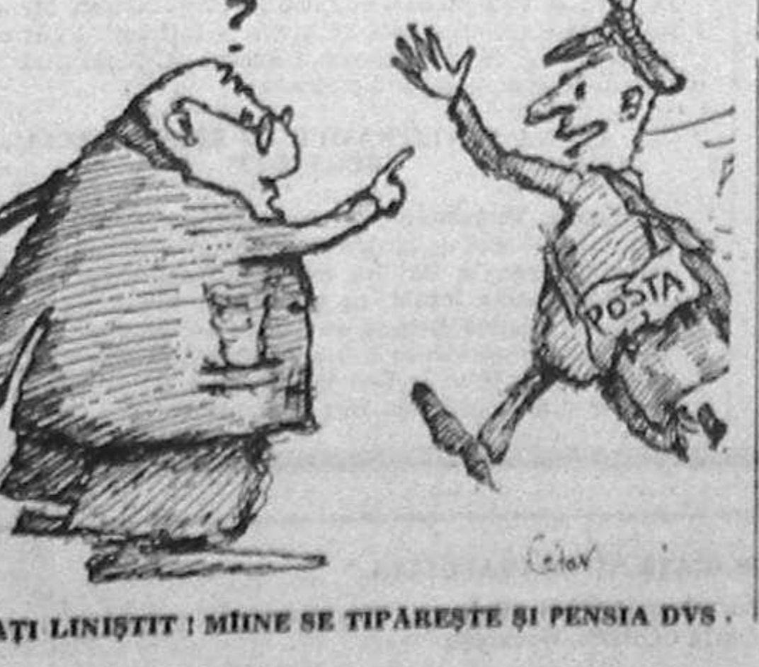
STAȚI LINIȘTIT ! MÎNE SE TIPĂREȘTE ȘI PENSA DVS . C.D.