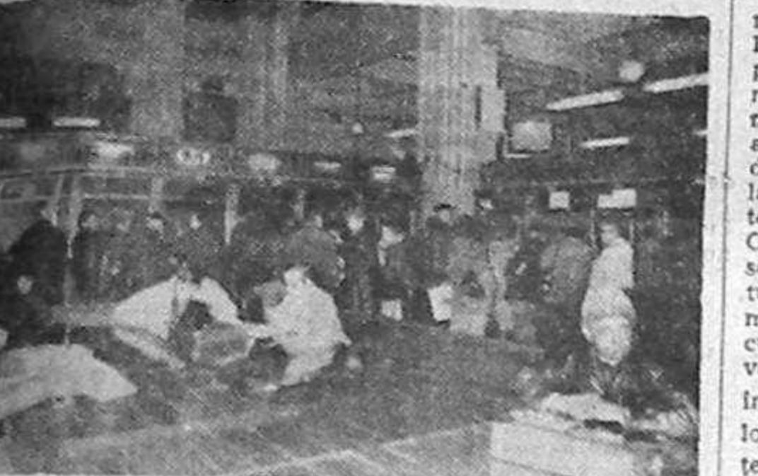
OFICIUL DE SCHIMB VALUTAR LA BANCA ROMÂNĂ PENTRU DEZVOLTARE