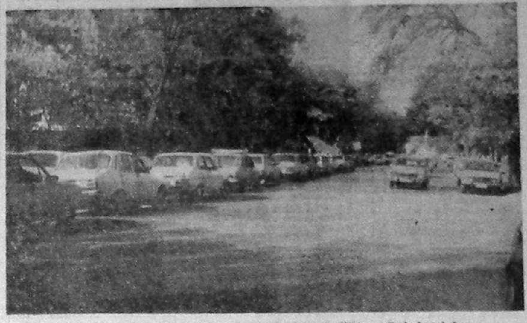
După o pauză de câteva zile am revenit în actualitate cozile la benzină