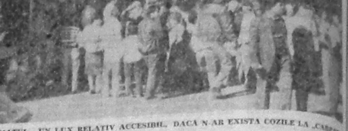
FUMATUL - UN LUX RELATIV ACCESSIBIL. DACĂ N-AR EXISTA COZILE LA CARBON...