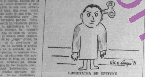
LIBERTATEA DE OPTIUNE