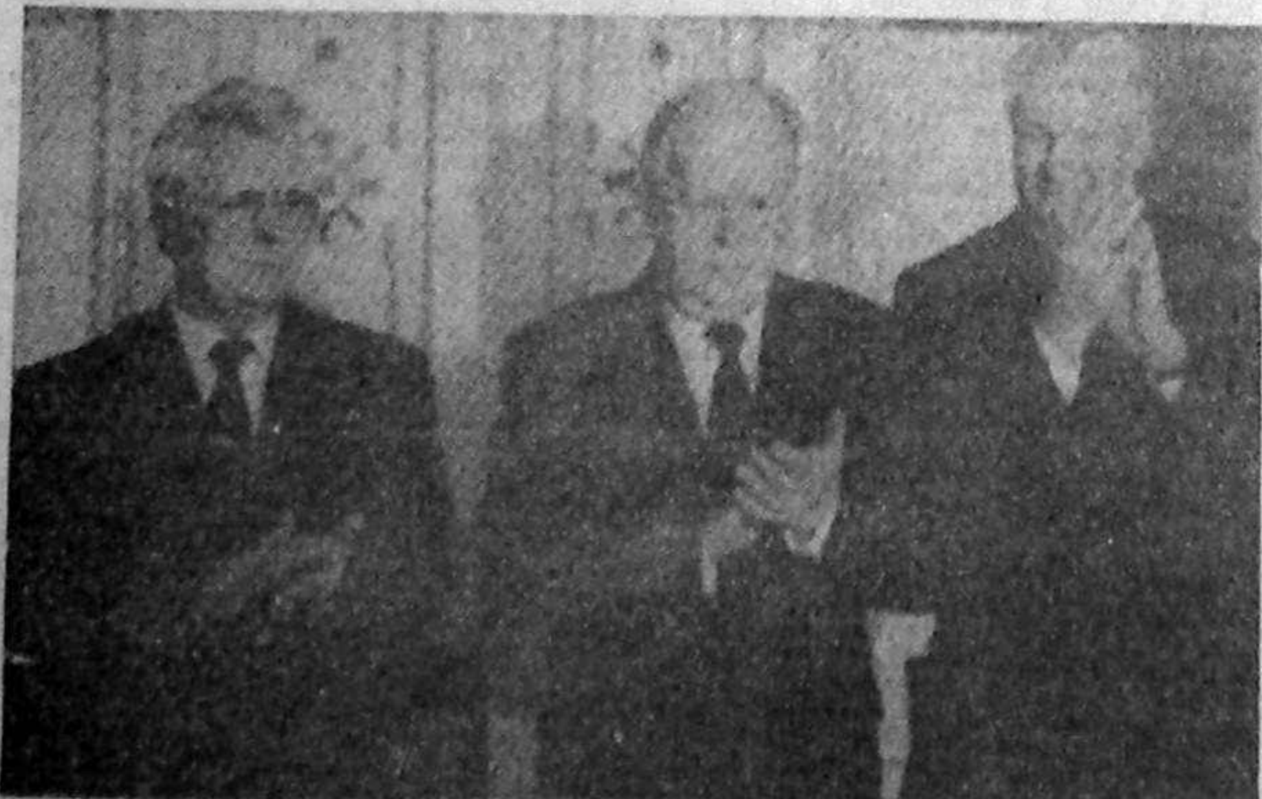
DE LA STINGA LA DREAPTA: LEONID KRAVCIUC (N. 1934, PREȘEDINTELE UCRAINEAN), STANISLAV ȘUSKIEVICI (N. 1934, PREȘEDINTELE BELARUS), BORIS ELTIN (N. 1931, PREȘEDINTELE RUS)

tații belarusi s-au pronunțat pentru denunțarea Tratatului unional din 1922 care „nu mai corespunde realităților actuale” și au hotărît ca acesta să fie declarat nul și neavenit în ceea ce privește statul Belarus. (Rompres)