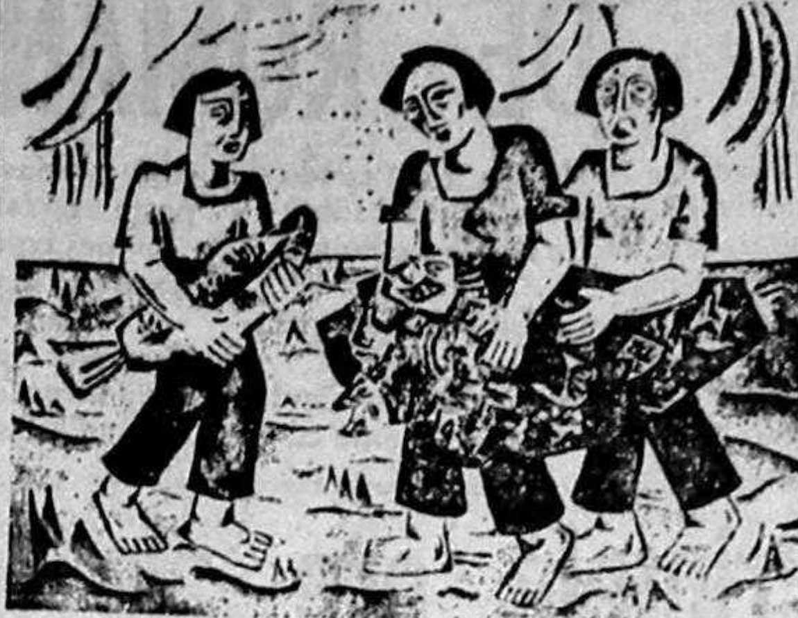
Compoziție de Dana Marinescu