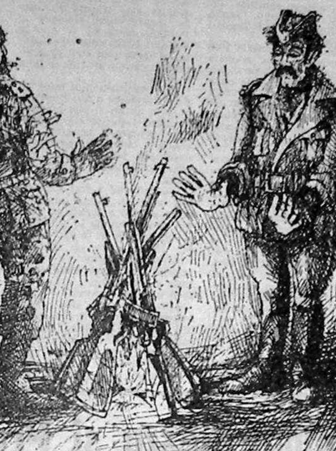
Armistițiul, a 15-a rundă

Președintele croat a exclus, totodată, ideea ca acceptarea planului să reprezinte o "mănevră tactică" a părții sârbe și armatei federale. În sprijinul acestei păreri el a exemplificat cu refuzul parlamentului Serbiei de a recunoaște Republica Sîrbă a Krajinei, proclamată în sudul Croatiei, unde populația sîrbă este majoritară.