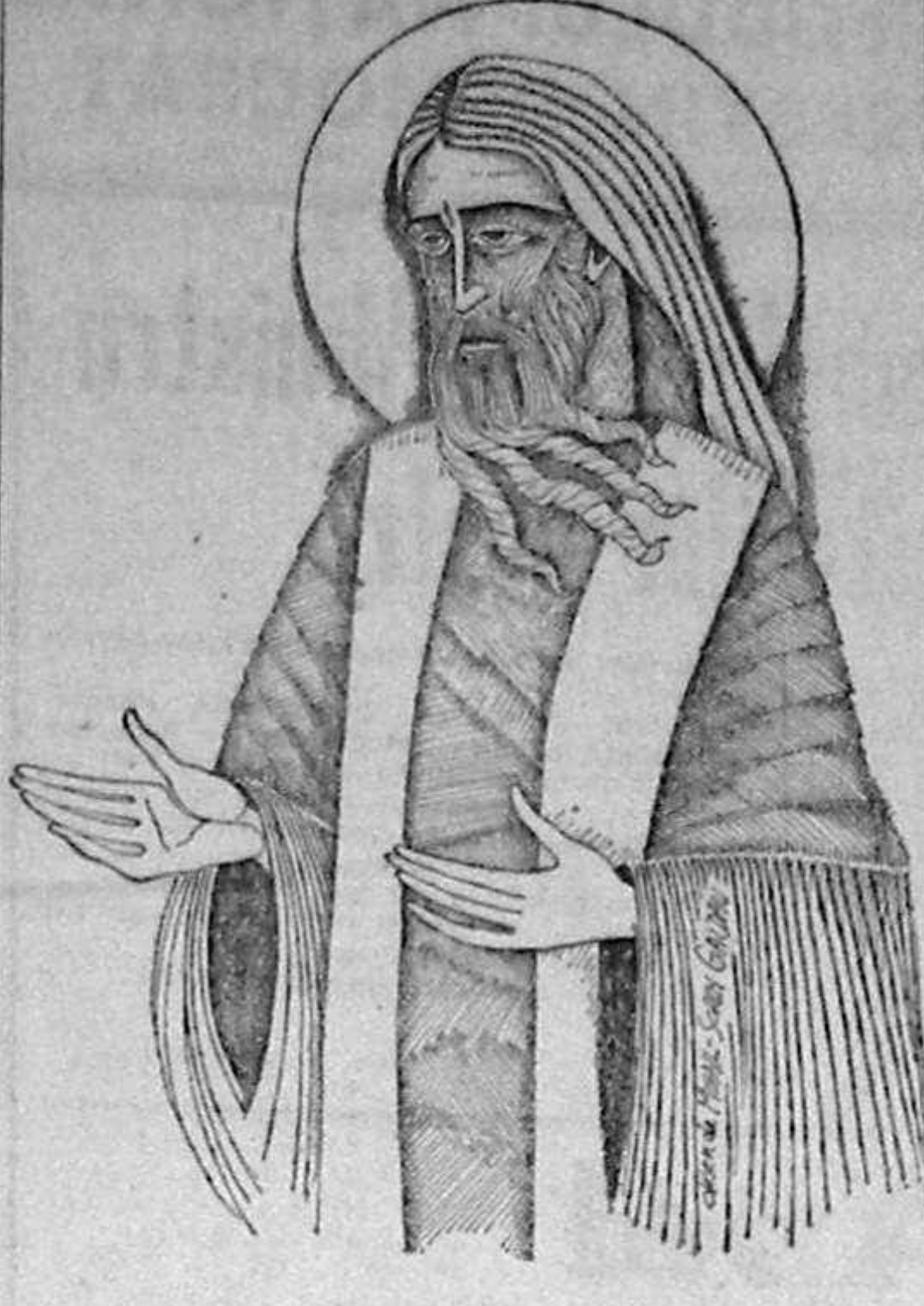
Sf. Ioan Botezătorul