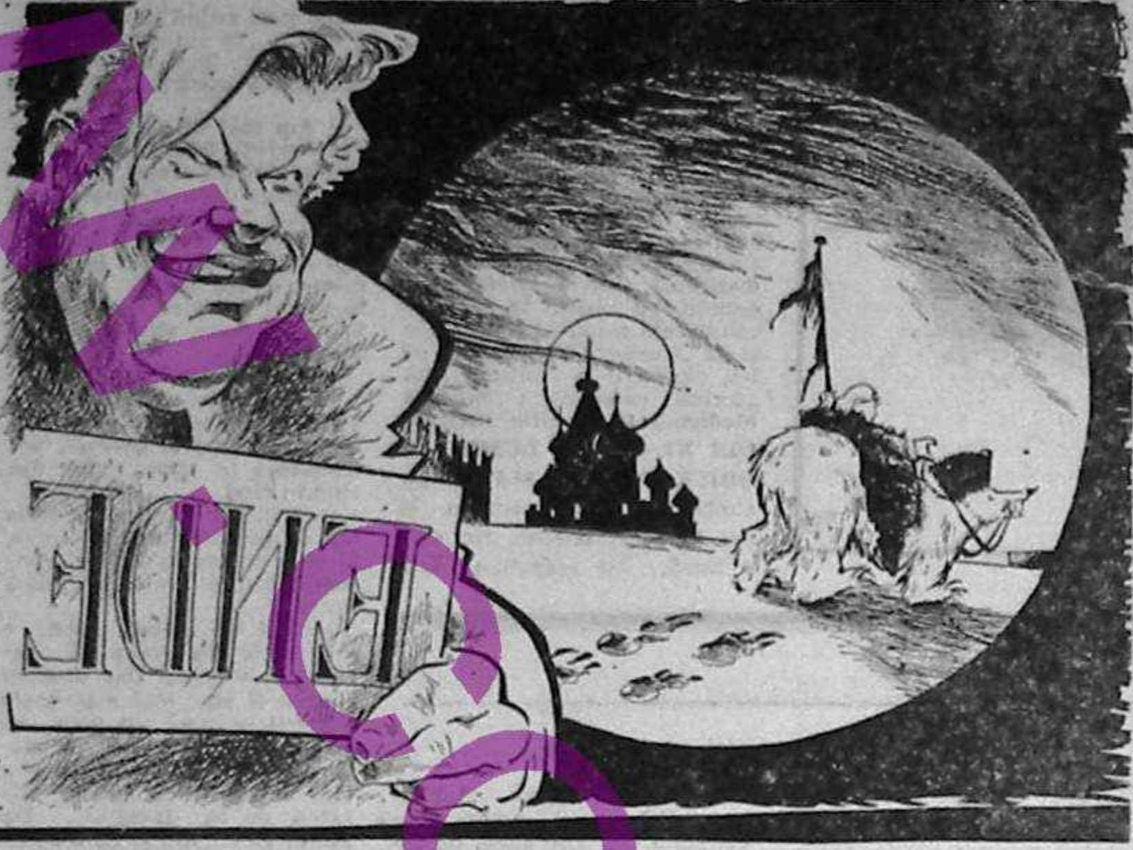
Din „Der Standard” (Viena).