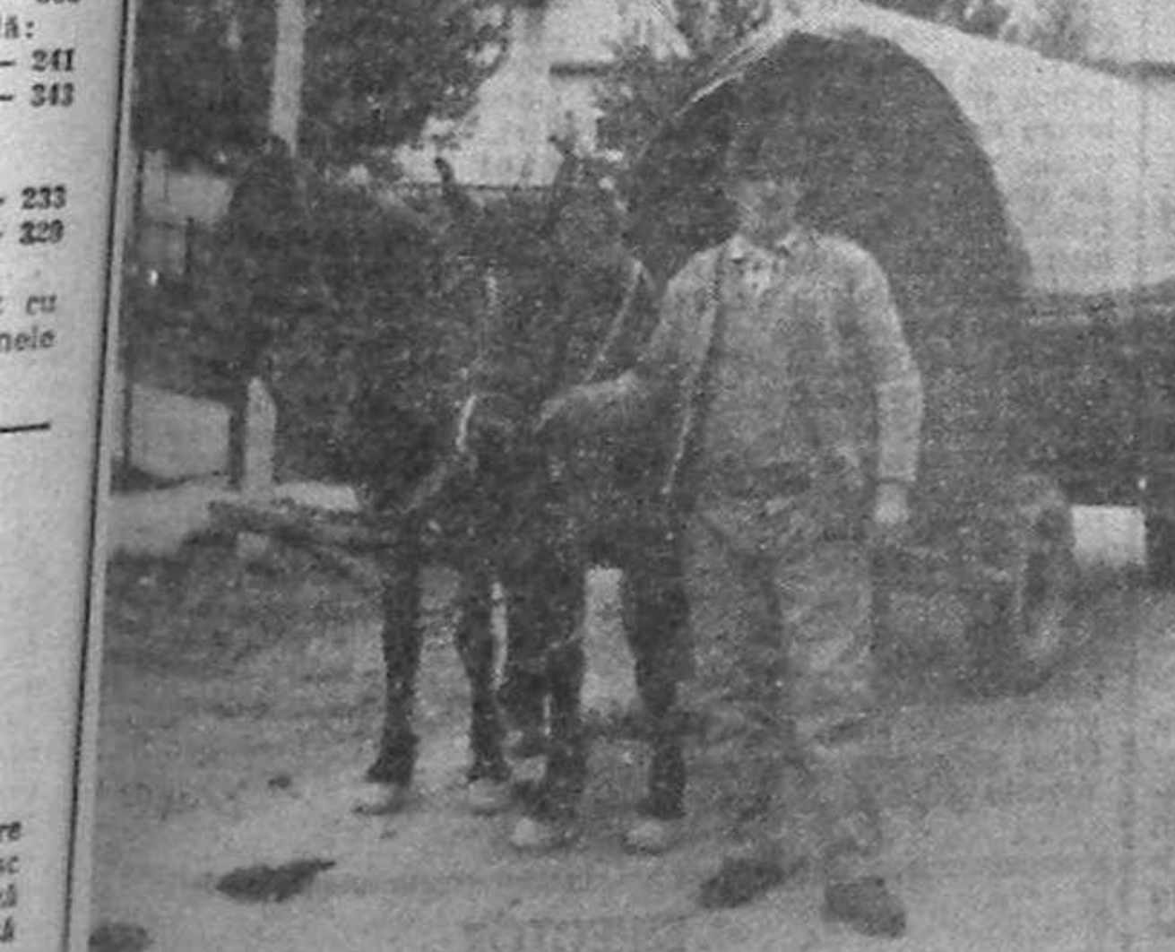
UNDE SĂ MAI CEREM DREPTATE?

Singurul efect pozitiv față de reducerea semnificativă a activității economice în anul 1991 l-a constituit diminuarea numărului accidentelor de muncă, conform datelor centralizate la departamentul de resort din Ministerul Muncii și Protecției Sociale. În 1991 au fost înregistrate 11 133 de accidente, din care 665 au fost mortale, cifre inferioare anului 1990. Cele 10 468 de cazuri cu incapacitate temporară au generat 406 475 zile incapacitate de muncă, în afara consecințelor sociale, rezultînd, de asemenea, pierderi economice importante, inclusiv cheltuielile de la bugetul de asigurări sociale.