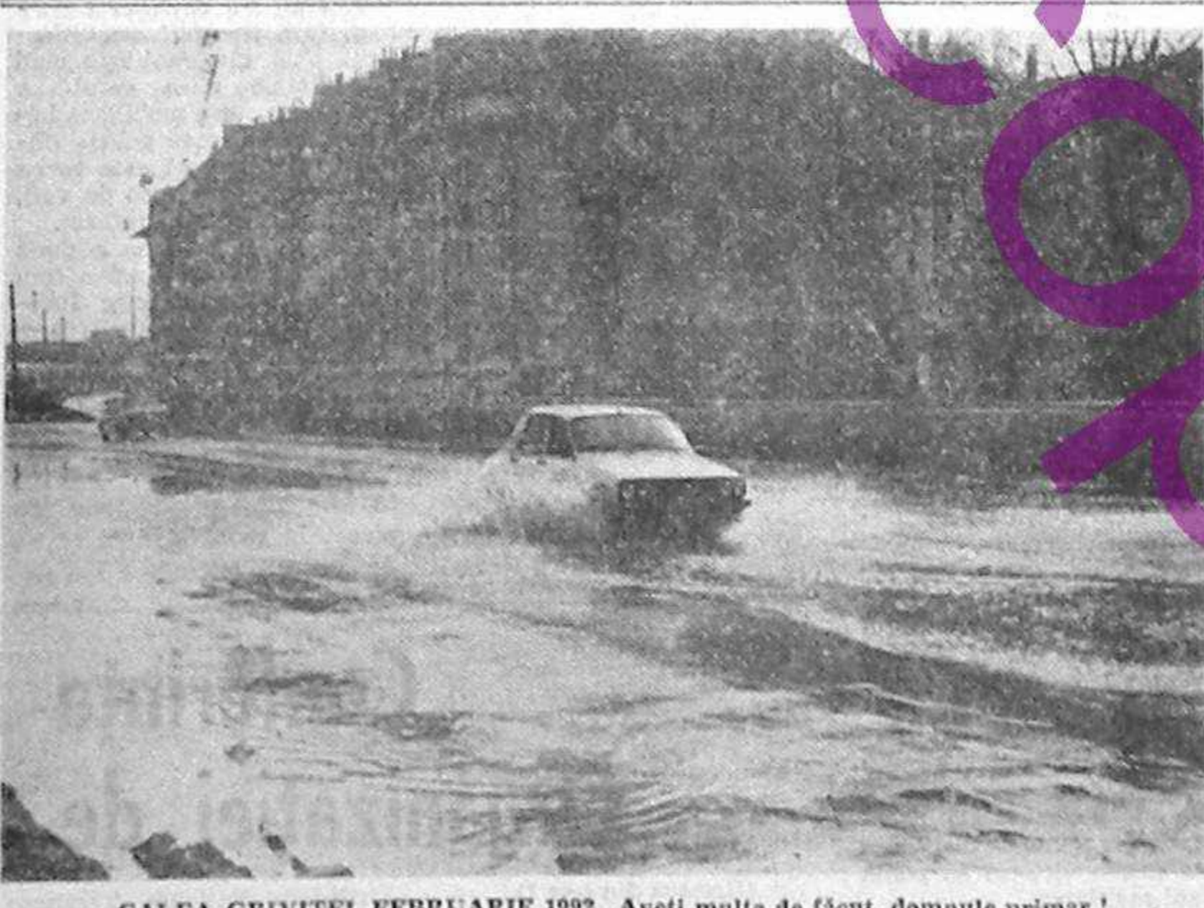
CALEA GRIVIȚEI, FEBRUARIE 1992. Aveți multe de făcut, domnule primar!