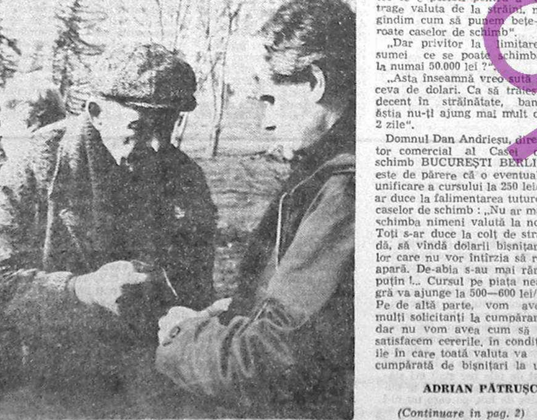
(Continuare în pag. 2)

...noua a lucrat și în trecut la ...arhivele CC, dar a subliniat ...că nu „a avut niciodată vreo ...legătură cu aparatul de par- ...tid”, ocupându-se numai cu ac- ...tivistă științifică. Arhivarul ...descrie „chiturile” foștilor ac- ...tiviști ai CC, care lucrează ac- ...um la Centrul de publicare a ...documentelor pe care le-au ...păstrat „de-a lungul anilor” în ...secret. „Este un proces psycho- ...logic dureros și el știu acest ...lucru. Dar au înțeles că trebuie ...să se adapteze noului curs”, a ...relevat el, menționând că nu ...a întipănit „rezistență” din ...partea lor; în schimb au exis-