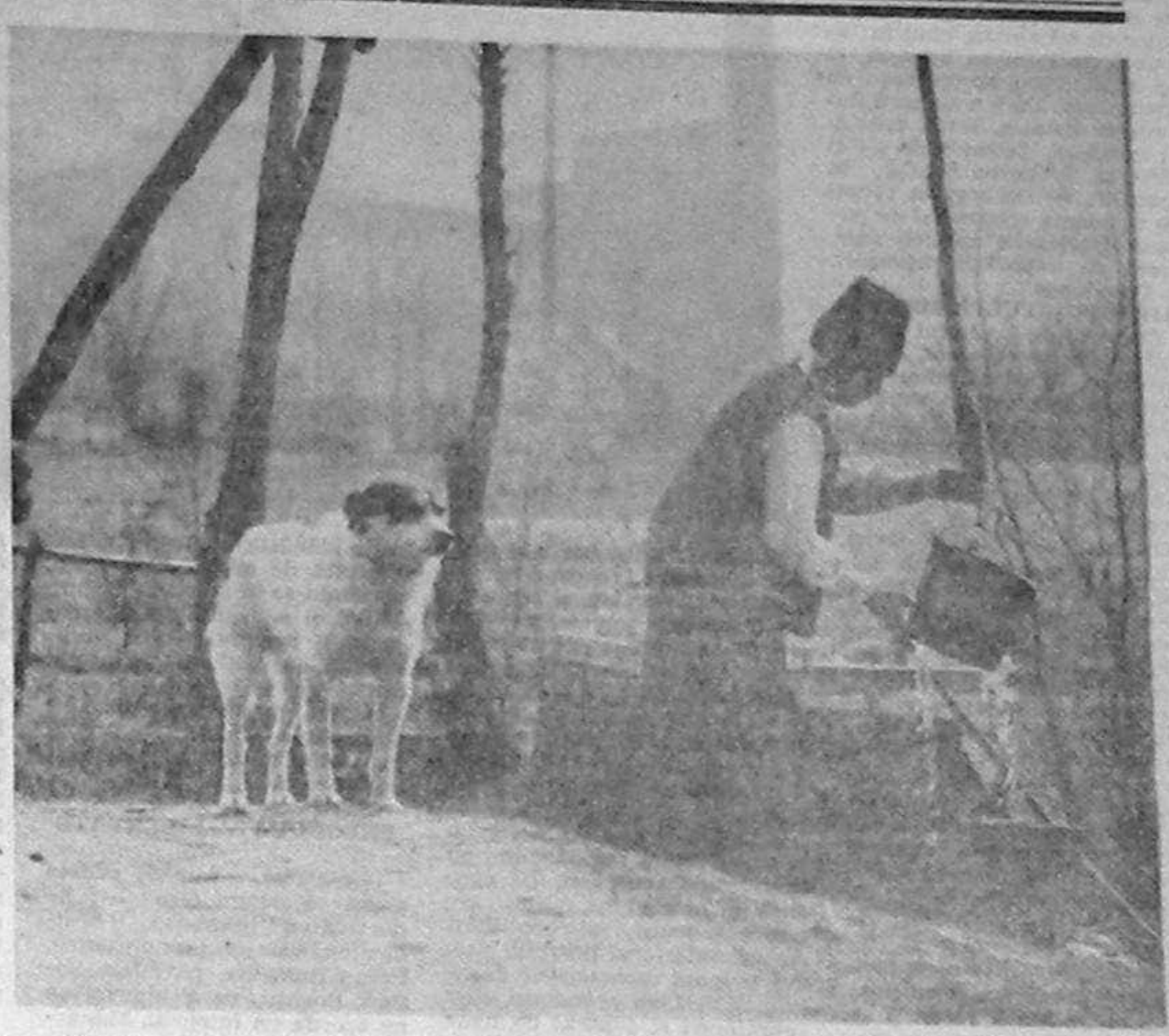
Stăpine, stăpine, mai cheamă și-un cine

Situația politică s-a schimbat. „Cei din urmă vor fi cei dinții”, a fost rezultatul primelor alegeri locale libere. Numai că, din păcate, potențialii structurilor neocomuniste nu vor să renunțe. După cazul Săpînța din Mar-