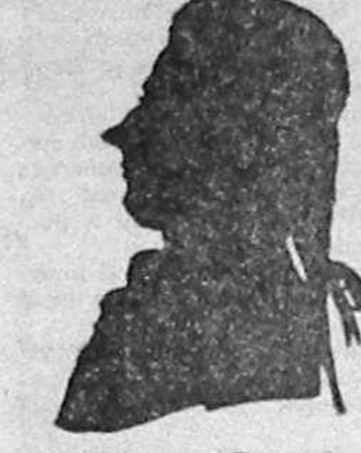
Francesco Benucci primul interpret al lui Figaro

zime părea să se îndrepte în ultimii ani al vieții, Keyserling este astăzi una din cele mai puțin cunoscute figuri ale deceniilor trei și patru.