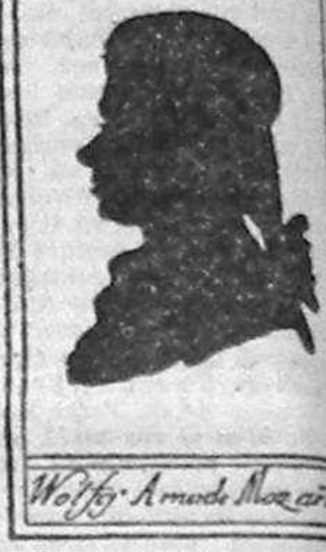
Wolff Amadeus Mozart