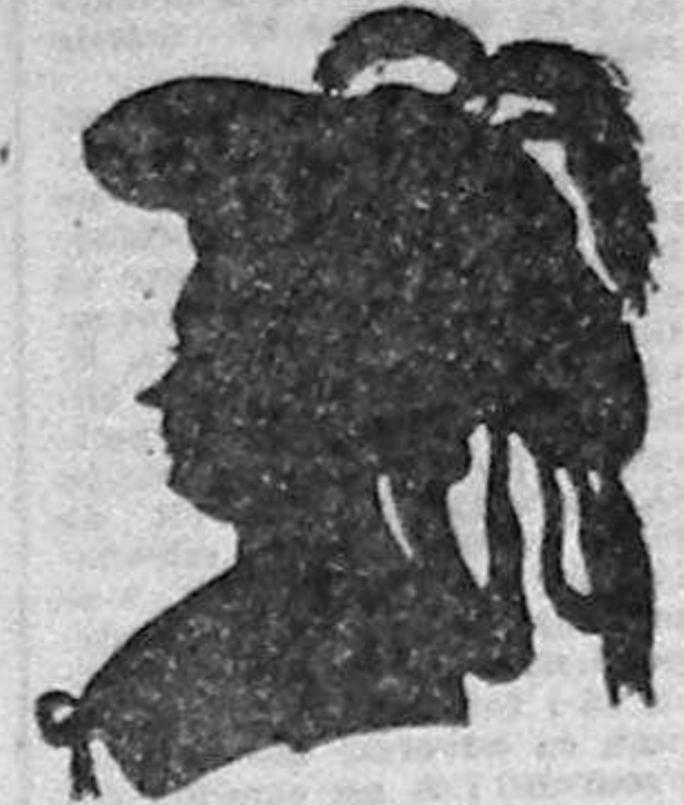
Ecaterina Cavaleri — Donna Elvira (1788)