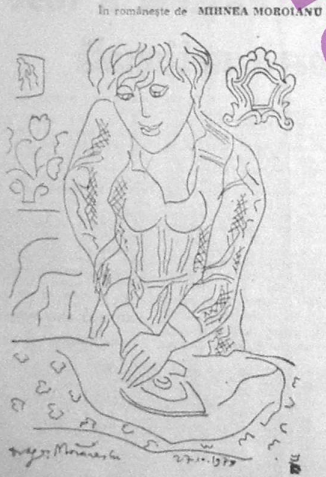
In românește de MIHNEA MOROȘINU