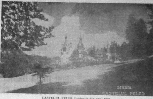
CASTELUL PELEȘ, ilustrat din anul 1929

ANUL XXIV (Seria a IV-a nr. 586) MARTI 5 mai 1992 4 pagini — 10 lei