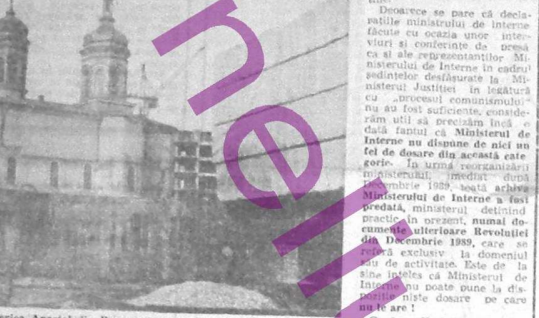
Biserica Apostol din București