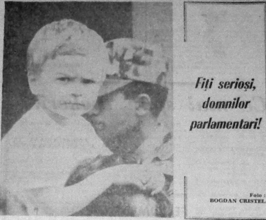
Fiti seriosi, domnilor parlamentari!