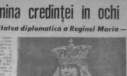
Regina Maria a fost înaltă de Dumezeu cu o inteligență și fermitate superioare... Ea a fost o femeie deosebit de inteligentă și activă, o mare și abilitată om politic, care și-a făcut faimă pe tot ce din jurul ei...