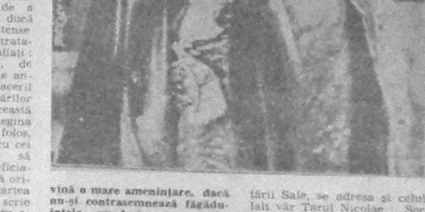
Domokoș Geza, liderul grupului parlamentar al PSD, a declarat că electoratul are încredere în candidatul Convenției... El a afirmat că este conștient de responsabilitățile care îi revin și că va face tot posibilul pentru a realiza programul său...