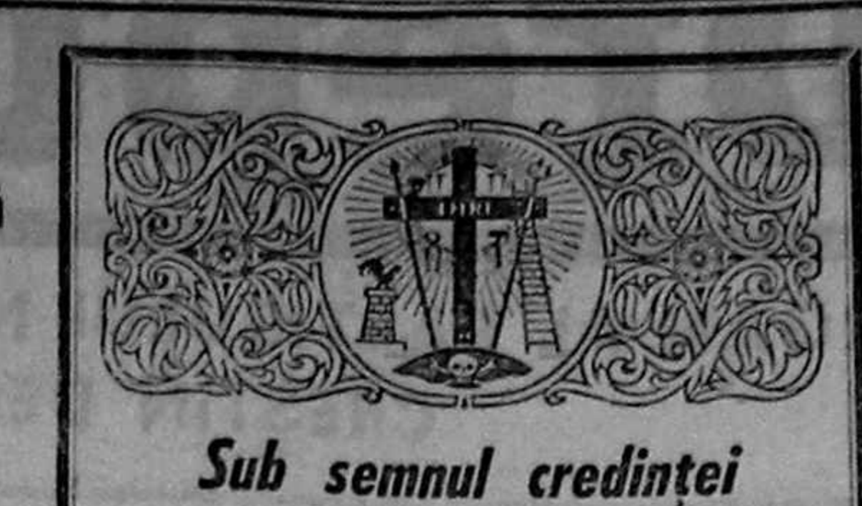
Sub semnul credinței