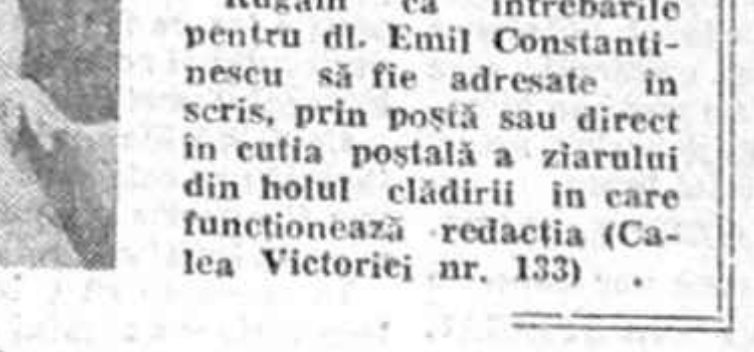
Rugăm ca întrebările pentru dl. Emil Constantinescu să fie adresate în scris, prin poșta sau direct în cutia poștală a ziarului din hotul clădirii în care funcționează redacția (Calea Victoriei nr. 133)

mie mi s-a părut un haos apocaliptic. Chiar dacă focul simbolizează secretul cunoașterii de cînd Prometeu l-a furat de la zei. Chiar dacă pentru Homer el însemna fertilitate, iar Virgiliu îl considera purificator pentru suflete.