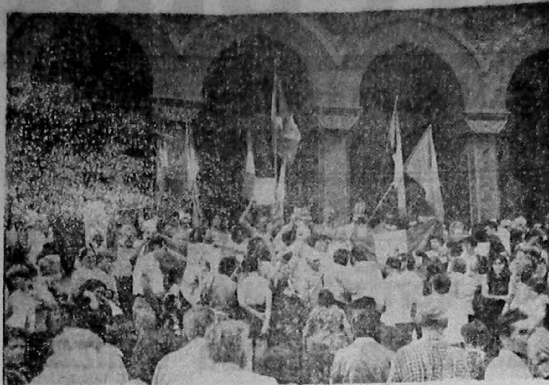
TIMISOARA 15 august 1992: Ar fi trebuit să vină Regele