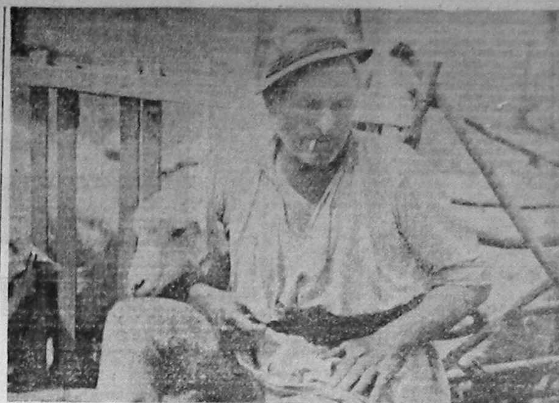
„Ori ești bolnăvicioasă, / Drăguță mioară...”

AUGUSTUS COSTACHE (Continuare în pag. a 3-a)