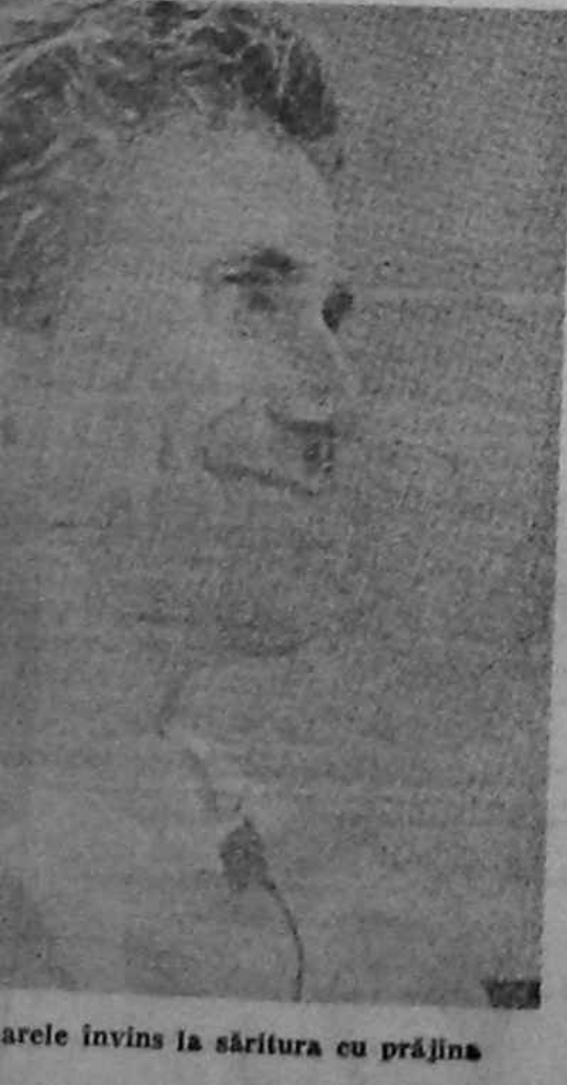
Sergei Bubka — marele invins la săritura cu prăjina

O etapă și un test, pentru cele de mai sus, ca și pentru multe altele, în vor constituie peste doi ani Campionatele Mondiale.