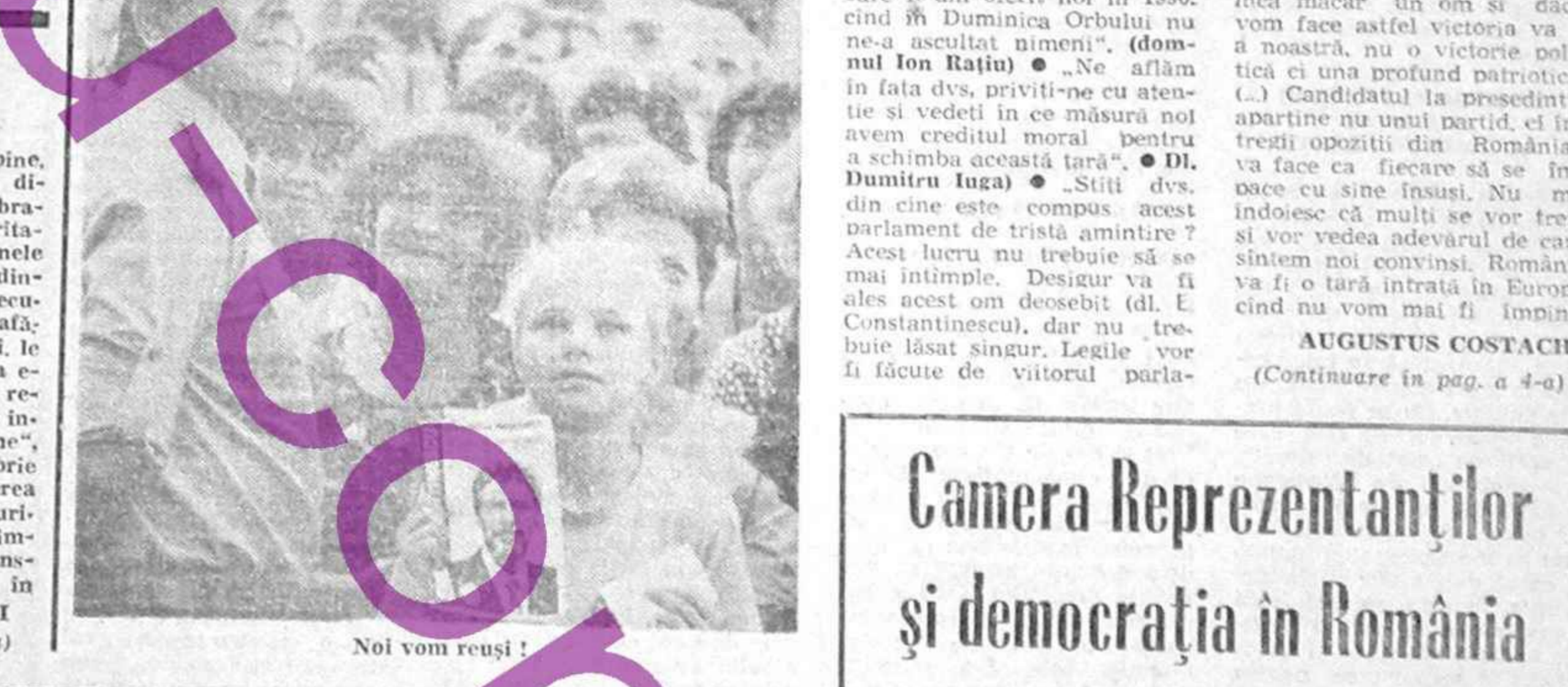
Noi vom reuși!

Dincolo de această „sireafă diversionară” a unghurilor, drea-din mers tot de ei — tică-losi mai sînt păgînii puste, vor zice în continuare insii dintr-un aluat cu C.V. Tudor — „pericolul” rămîne. Cum au mai făcut-o și pînă acum, maghiarii se vor mai întîlni, probabil, și în anul ce va să vină, se vor mai aduna și peste un sfert, jumătate, trei seferuri de secol. Mă rog, pînă cînd ne va mai ține — și pe unii și pe alții — Dumnezeu pe pămînt. Adunati ori ne adunati, unghuri nu vor, minca-i-ar pusta!, să uite Ardealul. Cum nu le vom pu-tea stîrpi această pofță — chiar dacă venim cu argumen-te indiscutabile — problema este ce facem noi, românii. Din păcate, (in)actualii noștri guvernănti se dedau, ca și înaintasul lor (condamnat) suprem, la aceeași politică pre-cară, de-a dreptul antinațio-nală, care ne tirăște în mocir-la penibilului. Să stăruim pu-tin. Pe vremea găuriturii cu „seminte” Kălasocov, occi-dentalii, nord-americanii, în-treaga lume era asaltată de propaganda bolșevică a Bu-cureștilui cu prefabricate despre „geniul Carpaților”. Ați li se cuvenea! Despre Transilvania, mai nimic... Lă-trătorii roșii ne imoulau nu-ă capul ce Ardealul este pămînt românesc, ca și cum ar exista vreun român să aibă altă părere. În vreme, ce dja-pora maghiară — în foarte bune relații cu Budapesta, de care era ajutat financiar — domina și continuă să domine — printr-un teribil material propagandistic despre Tran-