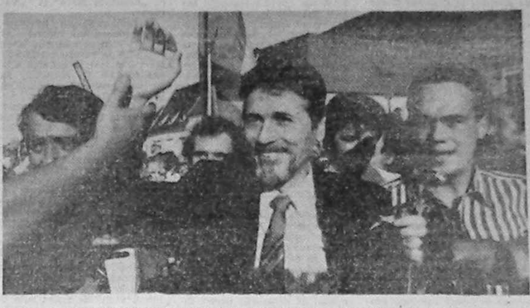
La mitingul de la Brașov, dl. Emil Constantinescu în mijlocul mulțimii