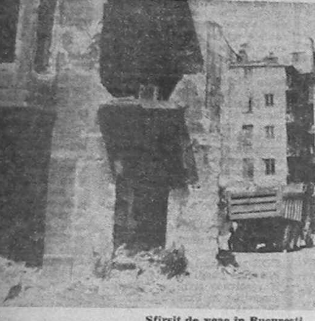
Stirșit de veac în București