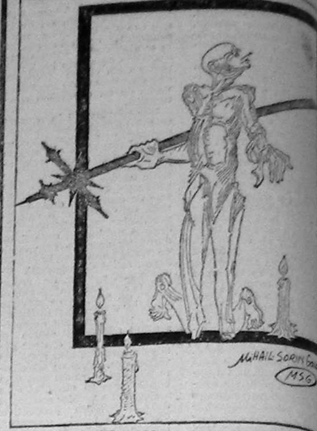
27 AUGUST 1992 BASARABIA - Un an de „independență” un an de suferințe

„Dacă aceste patru principii vor fi acceptate și puse în aplicare, toate părțile vor re-