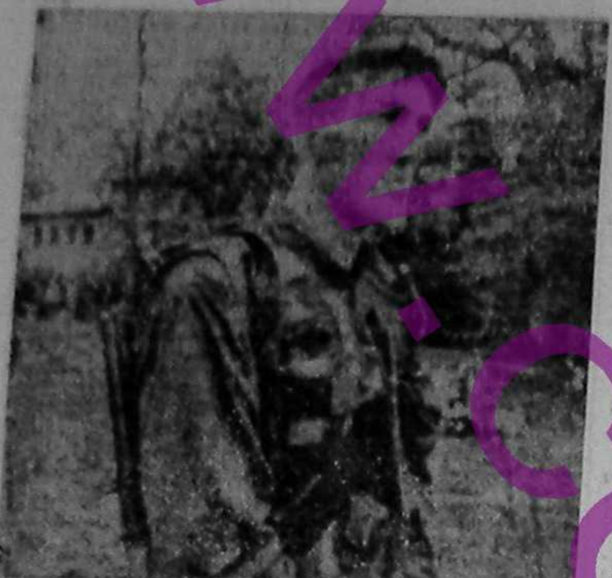
Un soldat bosniac in cimitirul militar din Sarajevo, dupa inmormintarea unor prieteni