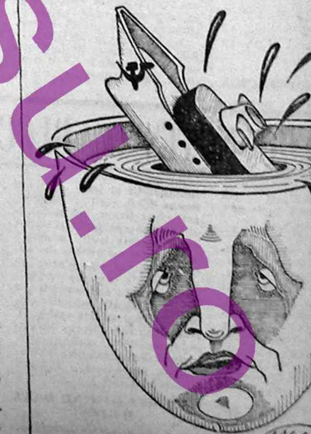
„SPERANȚE” ELECTORALE LA EDSN.

„Păcat că prea puțin vin să vadă și să înțeleagă...”