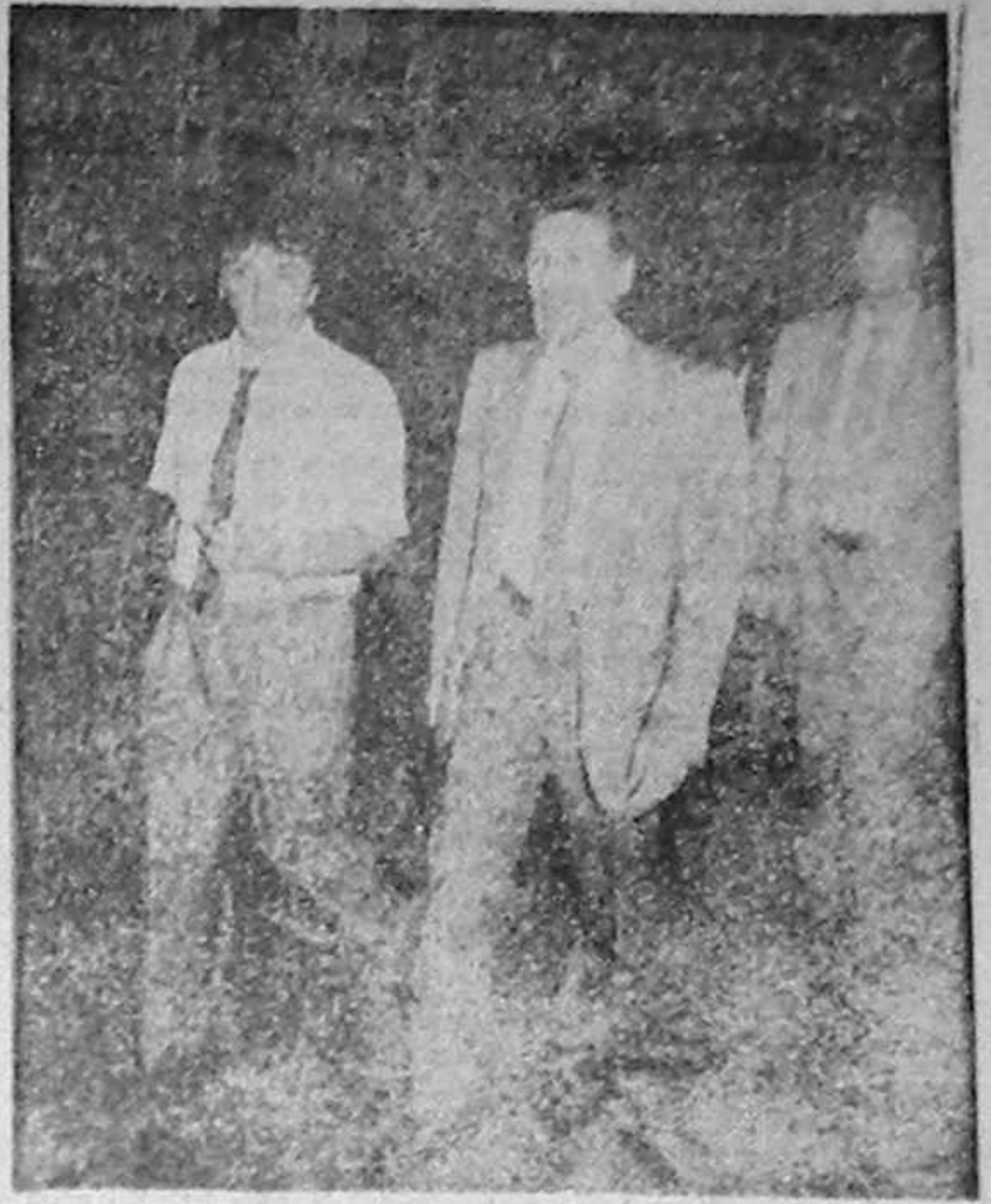
În timp ce — la Craiova, de exemplu — dl. Ilescu folosește pentru campania electorală mașinile prezidențiale, iar poliția și mașinile sale îi asigură protecția (în ce calitate?, de candidaț sau de președinte?), dl. Emil Constantinescu se deplasează în țară cu trenul. În fotografie: d. Emil Constantinescu, în Gara de Nord, miercuri dimineața (ora 5.30) înaintea plecării la Galați.

...și administrația: Victoriei nr. 133, et. 2 Telefon: 50.41.25 Fax: 50.64.44 Difuzare Telefon: 15.03.39 70179 București Cont de virament: 45.10.50/1106 Banca Comerțului Român, S.M.B. ...la putere repropoziți noui guvern ...ceeră un altu de pericol echilibrat ...simulana praburire a întregii ...suprapunere de erori — pudle ...Președintele statului și al se ...cămeri deputaților, scutierii lor ...și aserți, nu sî crută criticile la a ...propriei legislații, precum și a adm ...impință, altfel, de elemente fidele ...în cea mai clasică tradiție politica ...este chiar curios cum acest regim care a ...cu energie preluarea Paterii de la ...în bloc viața politică a României, de ...statului modern și pînă la im ...social, ce a caracterizat, cu deplina ...perioada celor patru decenii de to ...rosu. Aparent, doar curios, în fapt, ...Frontul — dlui Ilescu se află în ...și este foarte aproape de o și ...a unei forme de schimb pentru trecuta ...de clasă, la care Ceausescu revenise în ...săle luni de paraolă dictatorială. ...în aceste limite trebuie să ...de postie ale FDSN, atunci ...dlui Ilescu se referă la ...proclamaț to în cadrul unei ...dar a mea care să se sprijine ...dar cu piciorul sting. Au ...de altfel, readuse în actualitate declara ...ale anilor '45-'46, ale lui Gheor ...și Anei Pauker, tot atîtea făgădueli ...la viața politică, că nici gînd ...de naționalizări și alte rapuri, ...ce a urmat însă, se știe, cu toate că pe