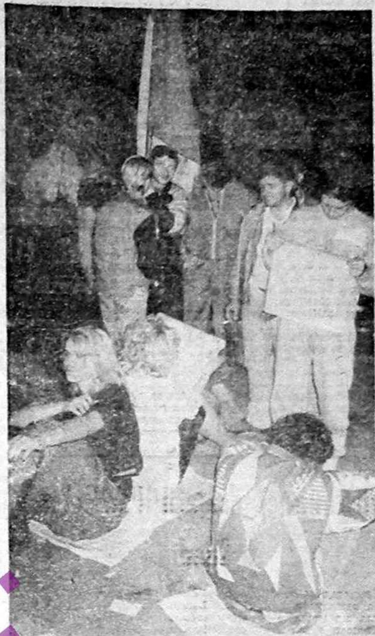
De câteva zile în Piața Universității din Capitală au loc mitinguri ale unor „golani” și „huligani”, în marea lor majoritate intelectualii. (Amplasate în pagina 4)

Amendamentul este similară față de un alt sediu P.N.T.-c.d. ne e adusă la cunoștință de dl. Tătaru Gheorghe din București care, în perioada 29-III-19, IV a.c. a fost la tratamentul în stațiunea Vatra Dornei. Aici a constat stupefiat că sediul P.N.T.-c.d. a fost devastat, foarte probabil, în noaptea de Inierne, Românii au se vede, un Dumnezeu răbdător; cel care procedea așa, nu au, probabil, decât un Dumnezeu meschin care se numește Marx. (DORA MEZDREA)