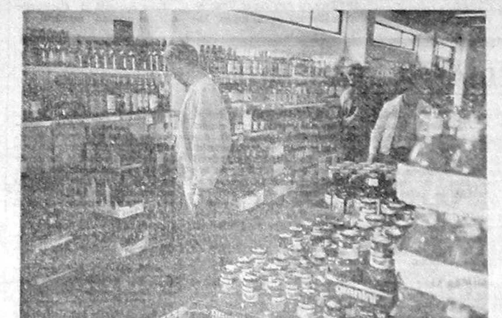
Stresant, foarte stresant! Nu e ușor să alegi, cum e rezistația la un asemenea consum nervos? La noi era o dată mai bine: ori găseai numai bere la chili, ori numai rachiu de vin. Amindună nu prea se găseau deodată în unitățile noastre "Falimentare"