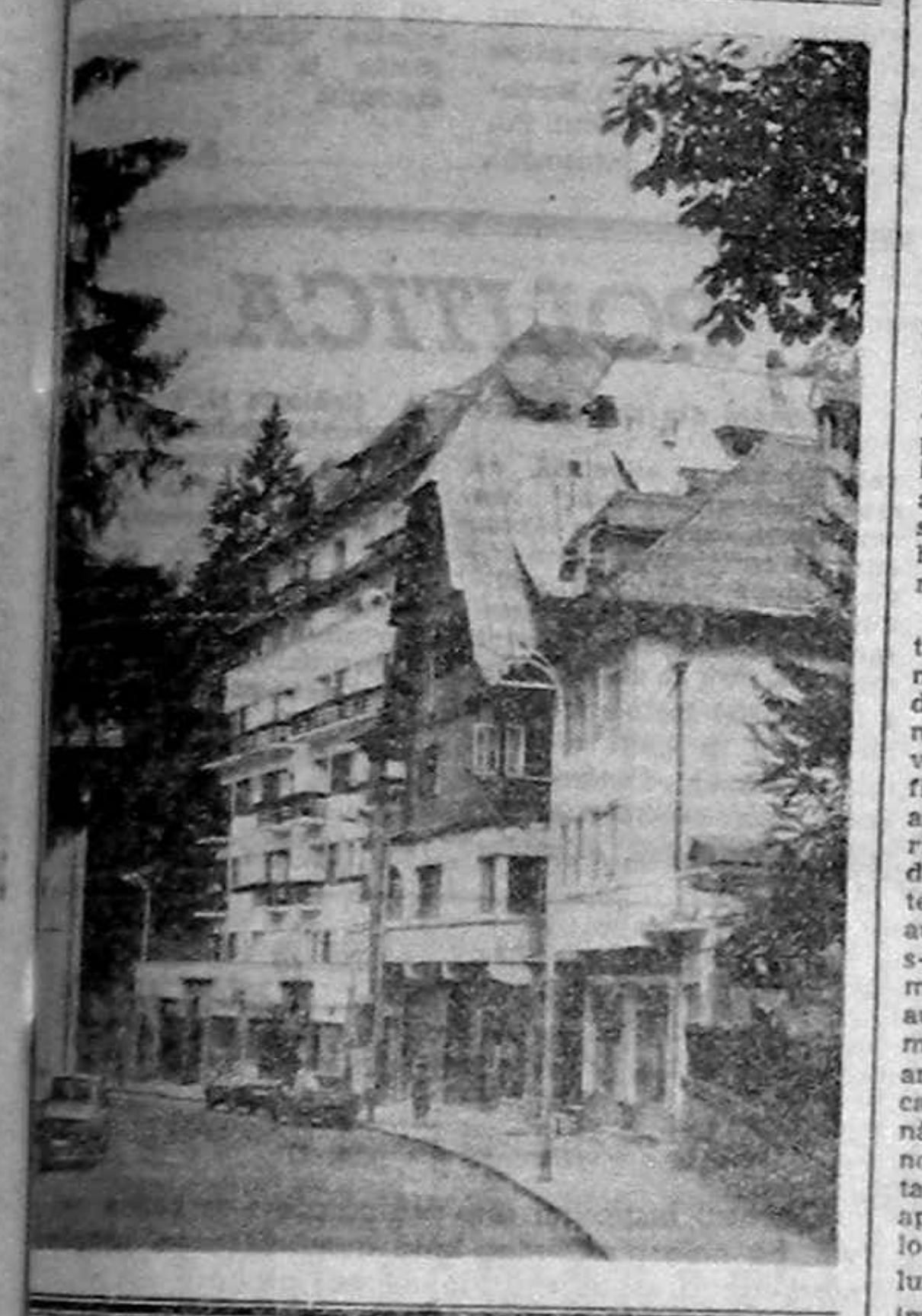
ROMANIA LUCREAZA CU LA SUTA DIN CAPACITATE

Da, dacă nu se schimbă nici în '93 - coboară, pe pământ, primarul - vom da înapoi cu 20 de ani, dacă nu mai rău. Eu sunt dispus să-mi sacrific buni prieteni, cu condiția ca în 4 ani să pot pleca din funcția de primar, cu fruntea sus.