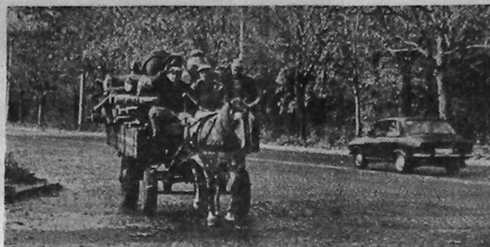
Program de guvernare pe trei luni