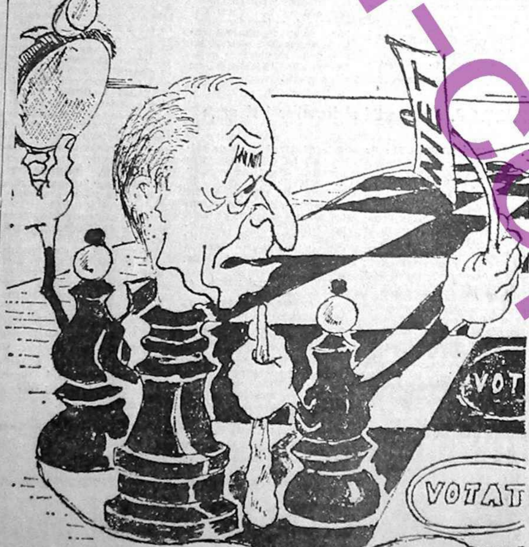
Cine se ia după nebuni, dă șah la rege