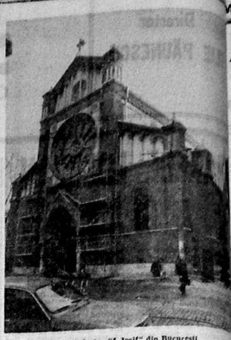
Catedrala „Sf. Iosif” din Bucuresti